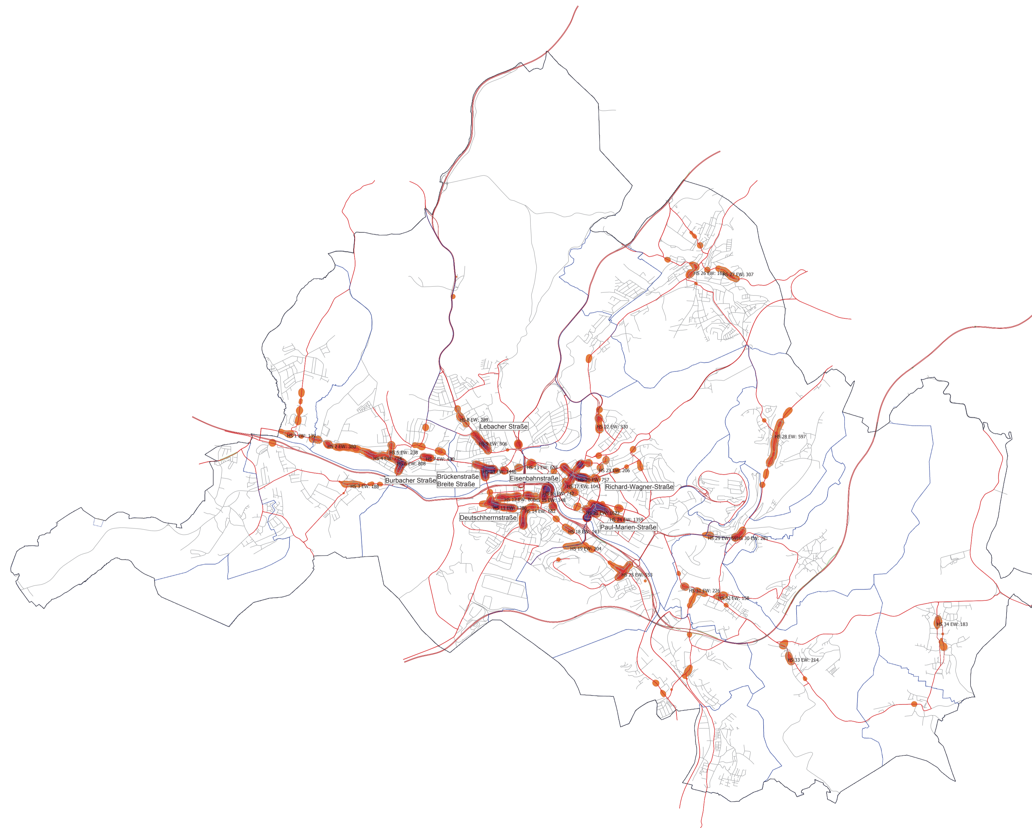
Abb 10 Stand 08/2014

Hot-Spot-Analyse \geq 70\text{dB(A)} Lärmindikator LDEN Freifeld