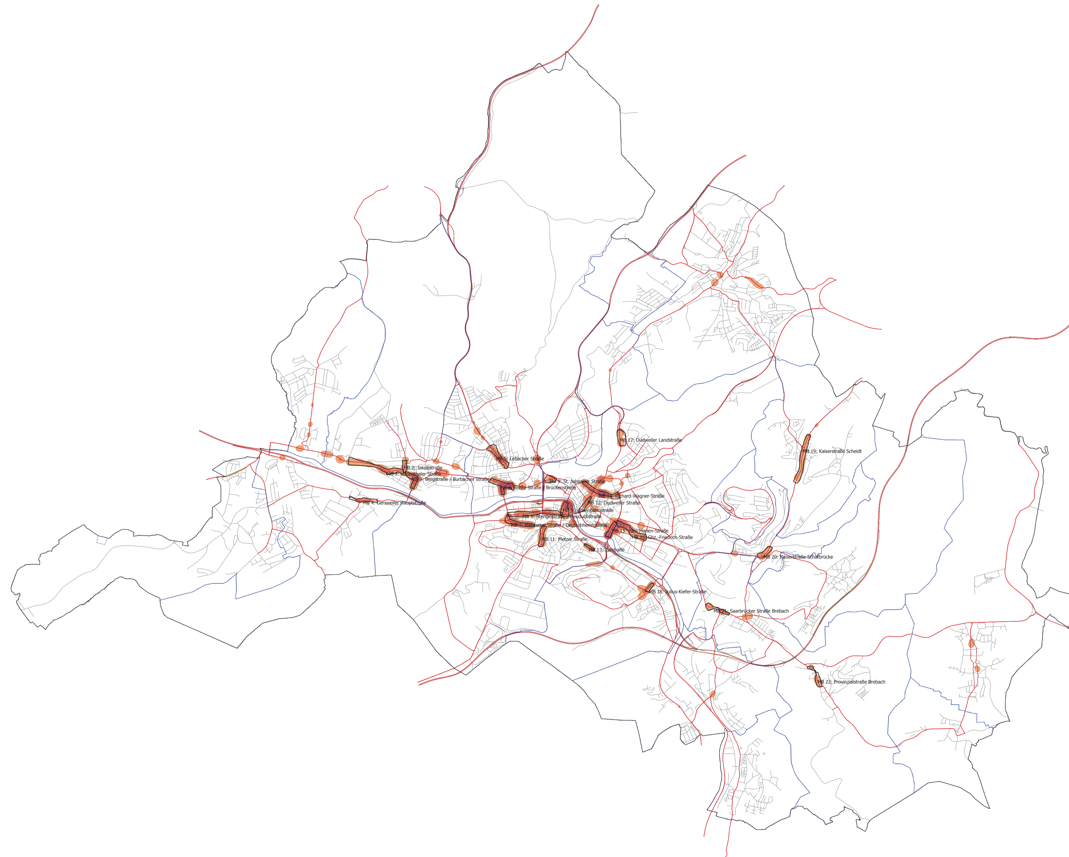
Abb 11 Stand 08/2014

Hot-Spot-Analyse \geq 70\text{dB(A)} Lärmindikator LDEN Maßnahmenbereiche