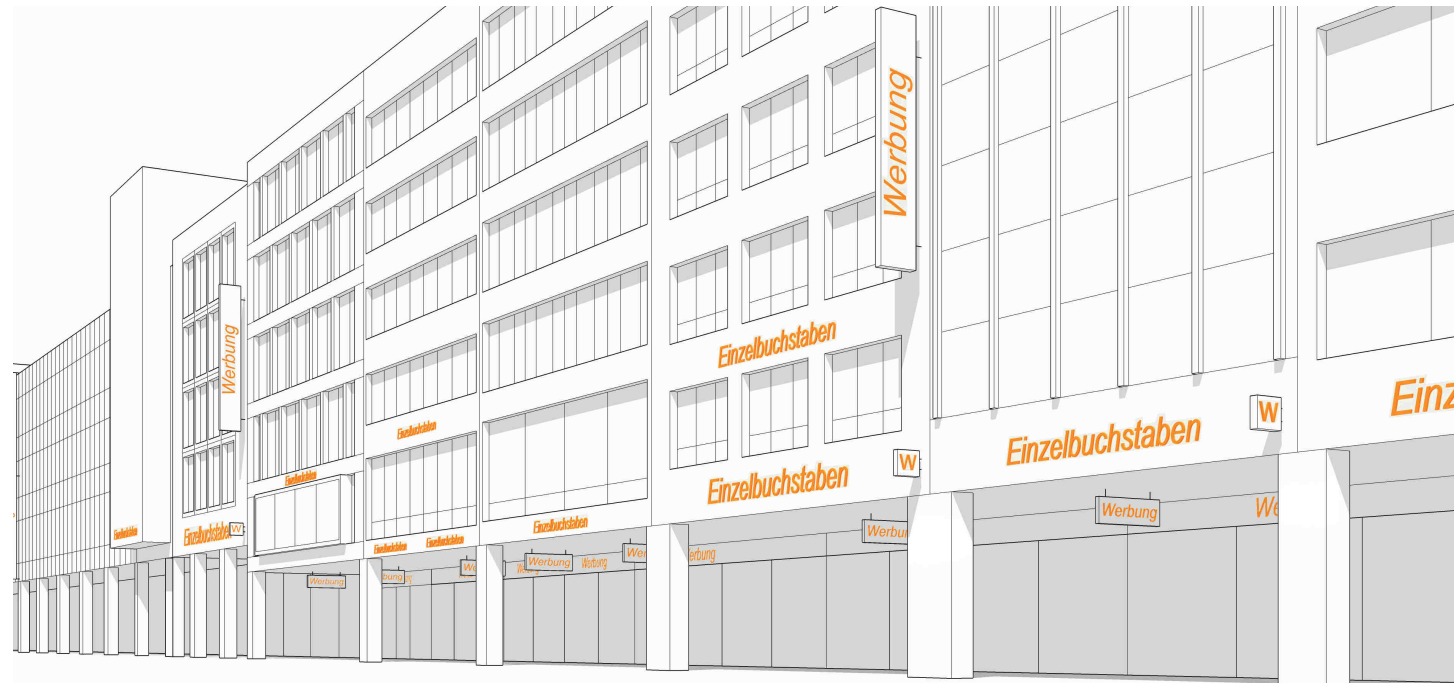
In Zone I, Bahnhofstraße, zulässige Werbeanlagen (unterschiedlich je nach Lage und Größe eines Gewerbebetriebs)