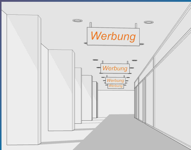
Werbe-Abhänger und LED-Deckenbeleuchtung in Kolonnaden

Wir stehen Ihnen gerne für eine persönliche und kostenlose Beratung zur Verfügung.