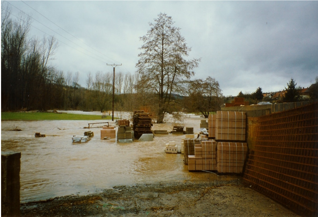
Unsachgemäße Lagerung in Überflutungsbereichen