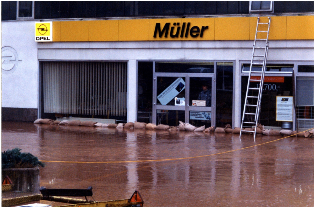
Schadenspotenzial durch Bebauung in Überschwemmungsgebieten