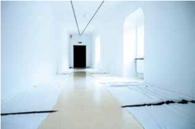
Matej Bosnić, πάσχειν (páskhein), 2021, Detail Ausstellung Stadtgalerie