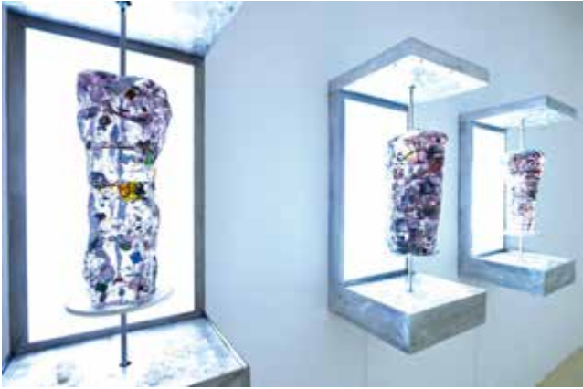
Gillian Brett, Smart food: better for you and the planet #Gyros, 2021