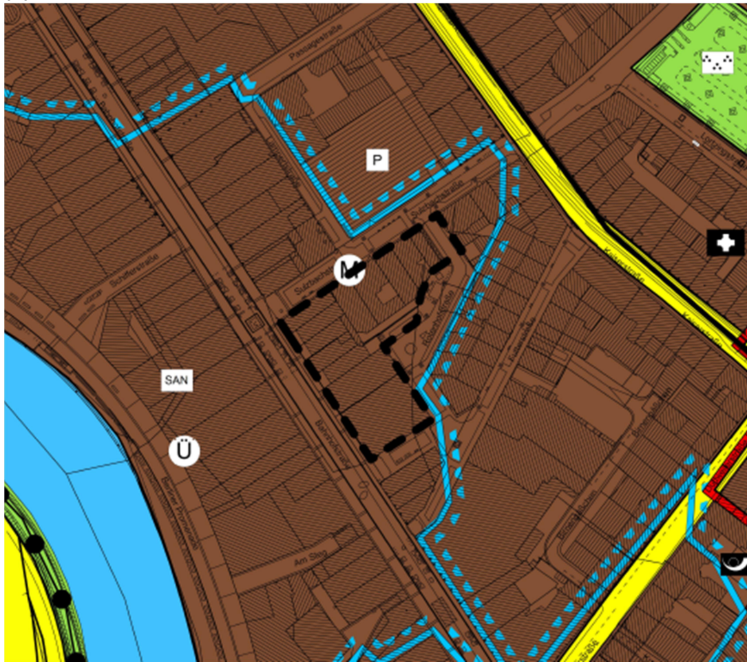
Abbildung 1: Darstellungen des wirksamen Flächennutzungsplans des Regionalverbandes Saarbrücken