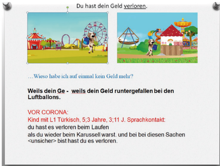
Ausschnitt aus der Präsentation mit Beispielen aus der „Wuschel-App“

Bei Jugendlichen hingegen ist der Erwerbsverlauf bereits stärker von weiteren Faktoren, z.B. der Herkunftssprache, beeinflusst und die Variation ist daher größer. Gezieltes Training steigert die Effektivität und besonders der Erwerb von konzeptioneller Schriftlichkeit stellt eine Herausforderung dar. Die durch die Pandemie entstandene „Lern-Lücke“ wird bei älteren Kindern und Jugendlichen vermutlich entsprechend größer sein und erfordert besondere Maßnahmen, um sie möglichst schnell zu schließen.