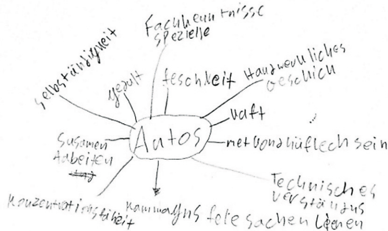
Schriftprobe eines Schülers (irakischer Kurde, 16 Jahre alt, vier Jahre in Deutschland)

Bei Jugendlichen hingegen ist der Erwerbsverlauf bereits stärker von weiteren Faktoren, z.B. der Herkunftssprache, beeinflusst und die Variation ist daher größer. Gezieltes Training steigert die Effektivität und besonders der Erwerb von konzeptioneller Schriftlichkeit stellt eine Herausforderung dar. Die durch die Pandemie entstandene „Lern-Lücke“ wird bei älteren Kindern und Jugendlichen vermutlich entsprechend größer sein und erfordert besondere Maßnahmen, um sie möglichst schnell zu schließen.