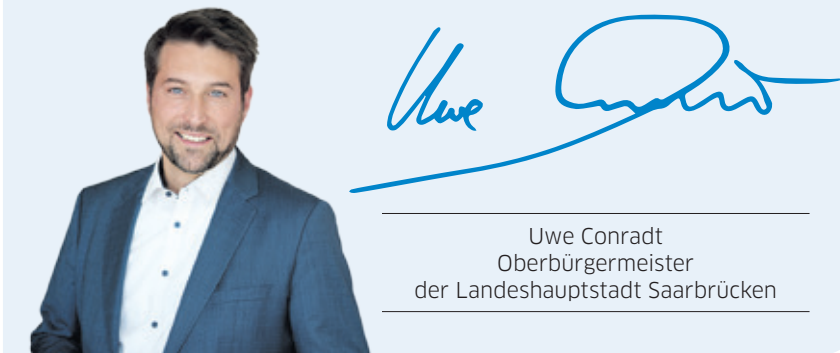
Uwe Conradt Oberbürgermeister der Landeshauptstadt Saarbrücken

Als Europäer, die den Nationalismus überwinden, sind wir gemeinsam stärker – heute und in Zukunft.