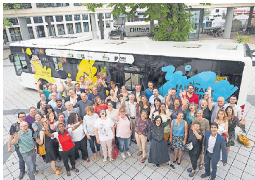
Teilnehmerinnen und Teilnehmer des Wettbewerbs „FAIRnünftiges Unternehmen“ am Tag der Preisverleihung 2019.

Der Wettbewerb wird gefördert von Engagement Global (Servicestelle Kommunen in der Einen Welt) mit finanziel-