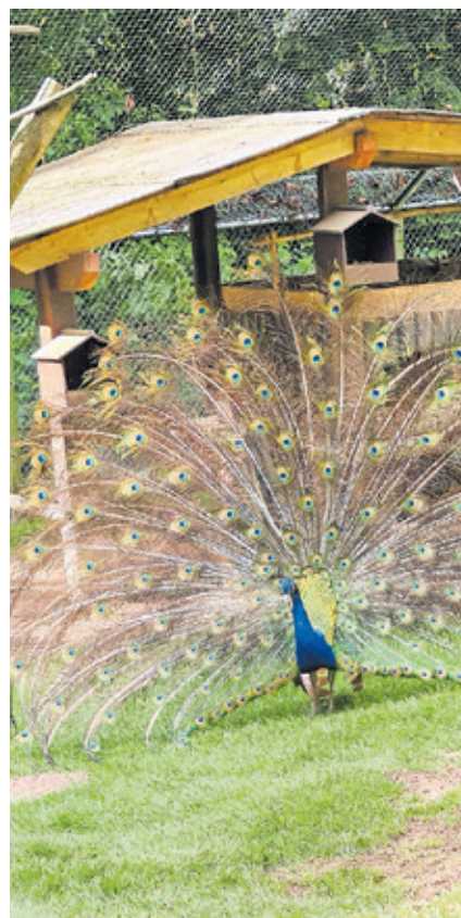
Beim Tierpatentag konnten die Gäste ihre Patentiere aus der Nähe beobachten.

Im Saarbrücker Wildpark fand am Samstag, 21. Mai, wieder der Tierpatentag statt. In den vergangenen beiden Jahren musste er pandemiebedingt ausfallen. Die Tierpatinnen und -paten konnten an einer Tour durch den Wildpark teilnehmen. Kinder durften am Ponygehege unter Aufsicht reiten. Seit Sommer 2014 bietet der Wildpark Patenschaften für seine Parktiere an. Sie haben eine Laufzeit von einem Jahr und können jederzeit verlängert werden. Viele Besucherinnen, Besucher und Tierfreunde haben das Angebot schon wahrgenommen, sodass das Wildparkteam im Januar 2019 die 100. Tierpatin begrüßen konnte. Mittlerweile ist die Zahl der Patenschaften auf 141 angestiegen. Beliebteste Patentiere sind die Ziegen, gefolgt von den Eseln und Schafen. Die eingenommenen Gelder aus den Tierpatenschaften werden ausschließlich für Tierfutter, Tierarztkosten und den Gehegebau verwendet.