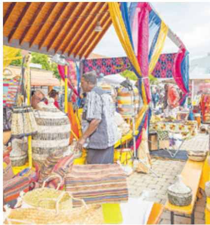
Eindrücke vom Orientalischen Markt 2019.

Der Orientalische Markt in Burbach findet dieses Jahr am Samstag, 4. Juni, 10 bis 20 Uhr, wieder in voller Größe auf dem Burbacher Markt statt. Mehr als 60 Anbieterinnen und Anbieter sind mit Kunsthandwerk und kulinarischen Spezialitäten aus dem Orient und Afrika dabei. Wer über den Markt schlendert, wird unter anderem Handarbeiten aus Südostasien und Kaschmirprodukte entdecken, außerdem Lederwaren, Zeichnungen, Schmuck, Olivenseife und orientalische Lampen.