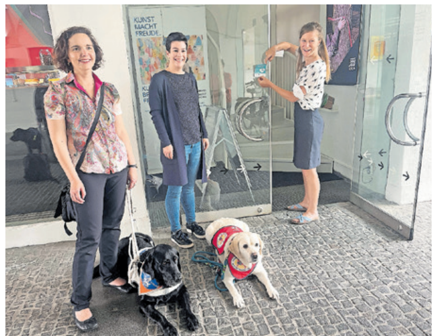
In der Stadtgalerie sind Assistenzhunde ebenfalls willkommen. Das zeigt nun auch der Kampagnenaufkleber am Eingang.

Die Kampagne „Assistenzhund Willkommen“ ist ein Instrument zur Verwirklichung des Nationalen Aktionsplans zur UN-Behindertenrechtskonvention (UN-BRK).