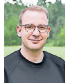
Tim Vollmer

Meine Vorstellung zur Stadtentwicklung Saarbrückens als innovativer