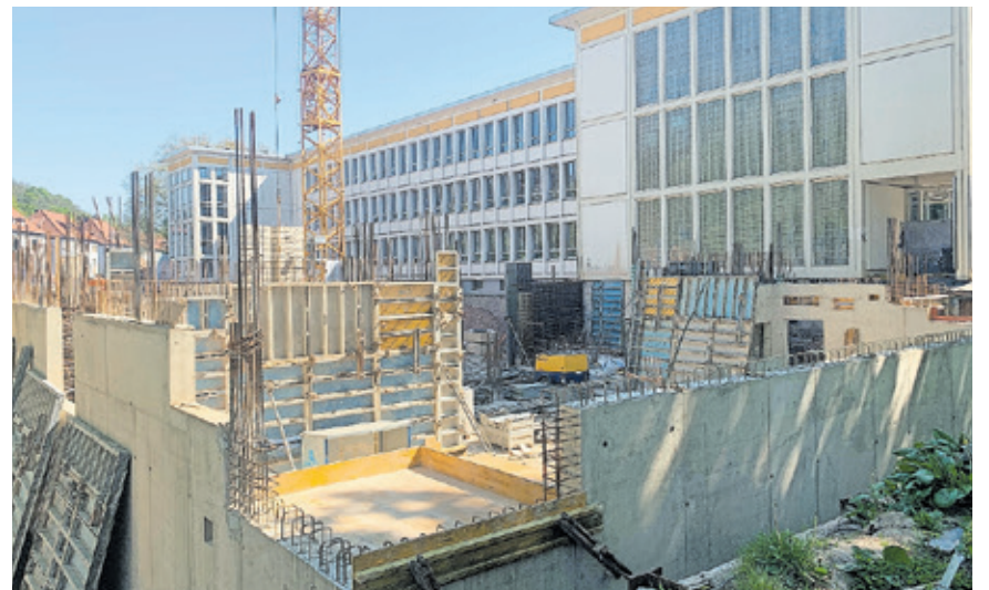
Arbeiten am Rohbau zur Erweiterung der Freiwilligen Ganztagsgrundschule Ost.

wurde dann die Bodenplatte inklusive der Wände im Untergeschoss errichtet und erste Gebäudeöffnungen als Verbindung zum Altbau wurden hergestellt.