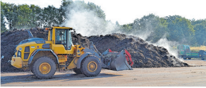
In der modernisierten Kompostieranlage stellt der ZKE Gütekompost in Biolandqualität her.