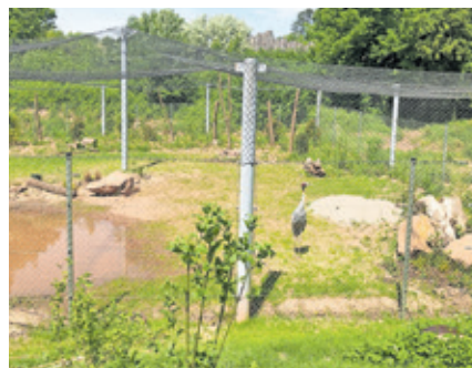
Die neue Anlage für die Kraniche im Saarbrücker Zoo wurde unter anderem mit einer Sumpflandschaft, einem Teich und Pflanzen natürlich gestaltet.

Die Baukosten für das neue Kranich-Gehege im Saarbrücker Zoo betragen rund 350.000 Euro. ZF Friedrichshafen AG und der Verein „Freunde des Saarbrücker Zoo e.V.“ haben die Maßnahme mit Zuwendungen unterstützt.