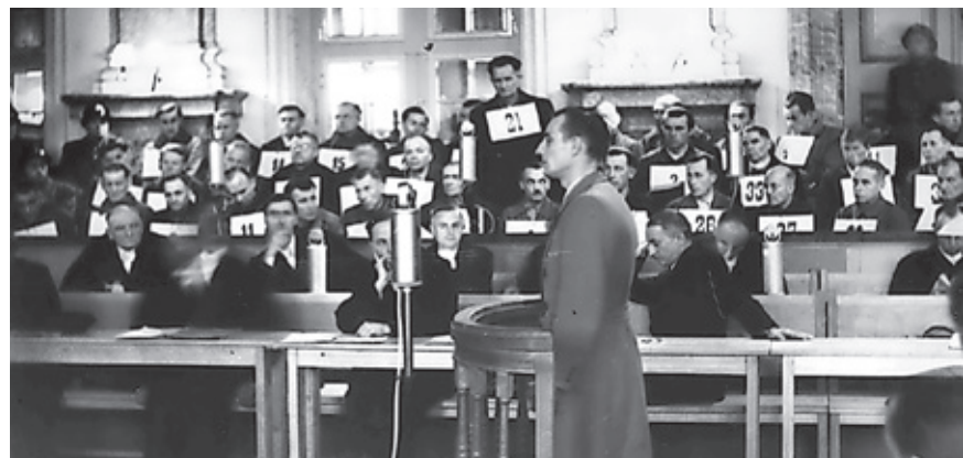
Zeuge bei der Aussage im Zuge der Rastatter Prozesse.

Stadtarchiv Saarbrücken Deutschherrnstraße 1 66117 Saarbrücken (Eingang von der Forbacher Straße) Telefon: +49 681 905-1258 E-Mail: stadtarchiv@saarbruecken.de