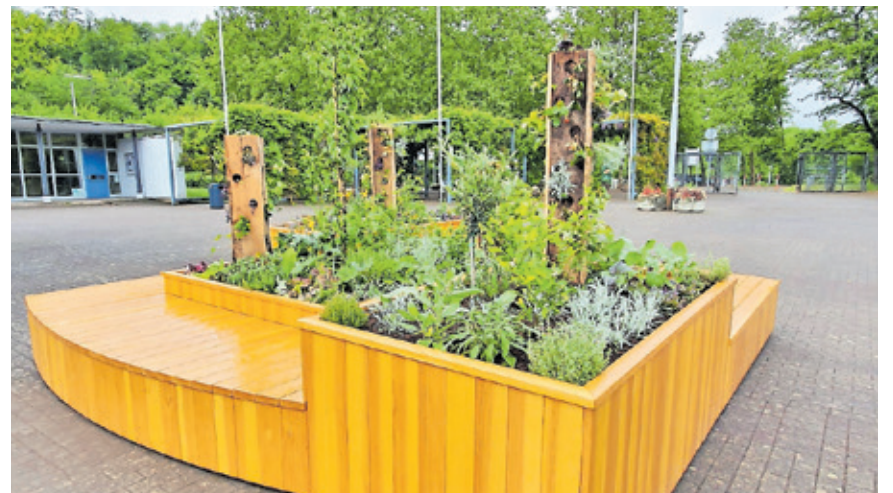
In dem neuen Hochbeet im DFG wachsen unter anderem Rhabarber, Zucchini, Erdbeeren, Salbei und Basilikum.

In dem Beet wachsen unter anderem Rhabarber, Mangold, Fenchel, Zucchini, Erdbeeren, aber auch Kräuter wie Basilikum, Salbei, Thymian, Schnittlauch und vieles mehr. Wenn die jeweilige Erntereife erreicht ist, können sich Besucherinnen und Besucher auch aus dem Hochbeet bedienen.