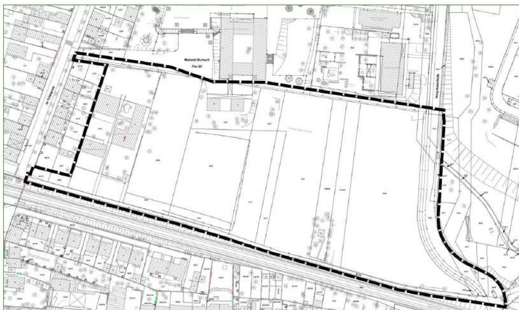
Abb. 1: Plangebiet „Bildungscampus Füllengarten“, Saarbrücken.

Damit ist eine Realisierung der beschriebenen Nutzungen unter Einhaltung der Festsetzungen des aktuell rechtskräftigen Bebauungsplanes nicht möglich. Der Bebauungsplan muss folglich geändert bzw. durch die vom Büro ARGUS Concept, Homburg, vorliegende Neuaufstellung ersetzt werden (Abbildung 1).