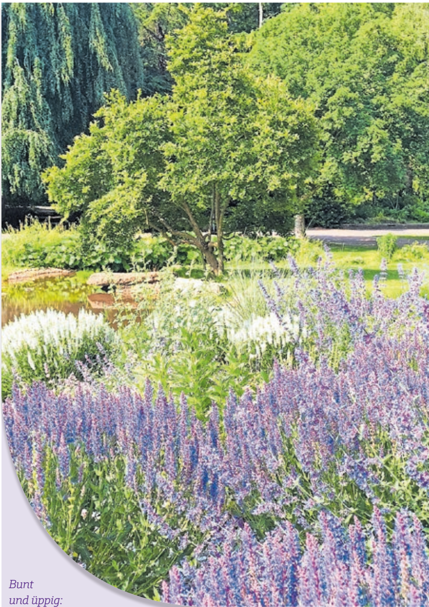
Bunt und üppig: Die Stauden im Tal der Blumen haben sich seit der Pflanzung im vergangenen Jahr sehr gut entwickelt.