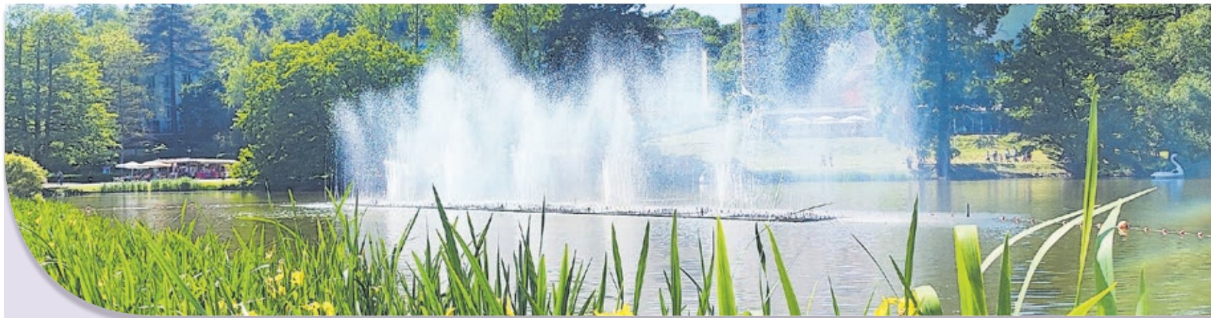
Die Wasserfiguren auf dem Deutschmühlenweiher mit musikalischer Untermalung zählen zu den Hauptattraktionen des DFG.