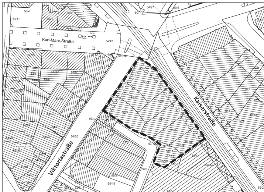
Übersichtsplan ohne Maßstab

Der seit 1969 rechtskräftige Bebauungsplan Nr. 131.02.08-09 „Bahnhofstraße I, Änderung der Baugruppeneinheit Bahnhof-, Viktoria-, Kaiser-, Passagestraße“ setzt für den Bereich des ehemaligen Kaufhauses die Zahl der Vollgeschosse auf VI bzw. V + I sowie in einem Teilbereich eine eingeschossige Hinterhofbebauung fest. Der Investor beabsichtigt die Umsetzung von 6 Vollgeschossen + 2 Staffelgeschossen. Die Planung ist daher mit dem geltenden Planungsrecht nicht vereinbar. Vor diesem Hintergrund soll zur Ermöglichung des Vorhabens das Planungsrecht entsprechend angepasst werden.