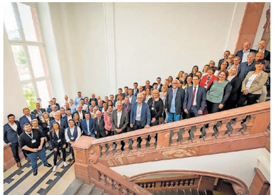
Die Teilnehmerinnen und Teilnehmer der Konferenz des 115-Verbunds.

Die Veranstaltung bot die Möglichkeit für Mitarbeiterinnen und Mitarbeiter von Service-Centern aus ganz Deutschland, sich miteinander fachlich auszutauschen. Außerdem ging es auch um die Frage, welche Weiterentwicklungsmöglichkeiten Künstliche Intelligenz etwa in Form von Chatbots und Sprachdialogsystemen für den Bürgerservice bieten könnte.