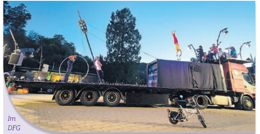
Im DFG wurde dieses Jahr das Festival Perspectives mit einer beeindruckenden Vorführung eröffnet.