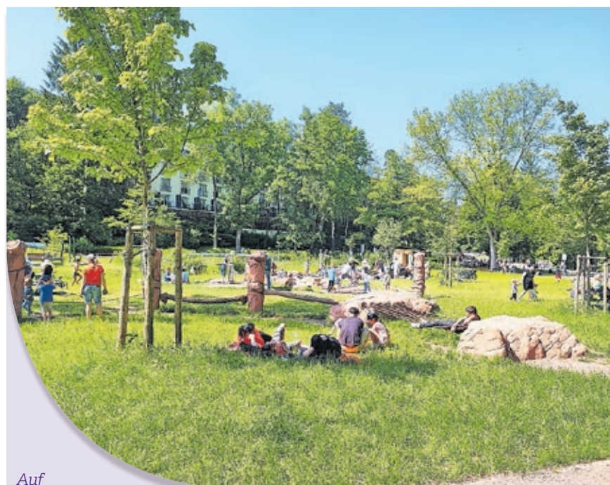
Auf dem neuen Kleinkinder- und Wasserspielplatz in der ehemaligen Gulliverwelt können sich Kinder nach Herzenslust austoben.