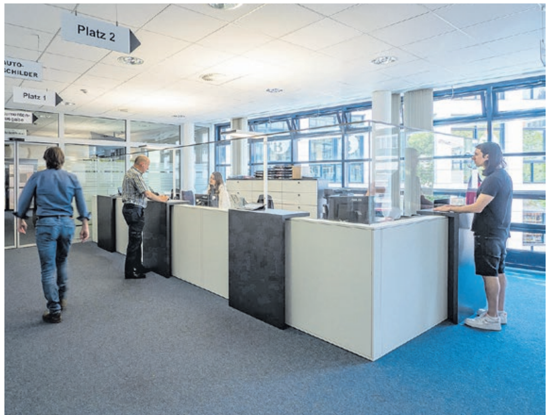
An der neuen Infotheke im Bürgeramt City können Kundinnen und Kunden unter anderem Dokumente wie Ausweise und Pässe abholen.