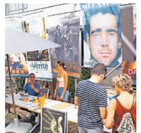
Das Filmhaus veranstaltet im Rahmen des Sommerfestes wieder seinen beliebten Plakatflohmarkt.