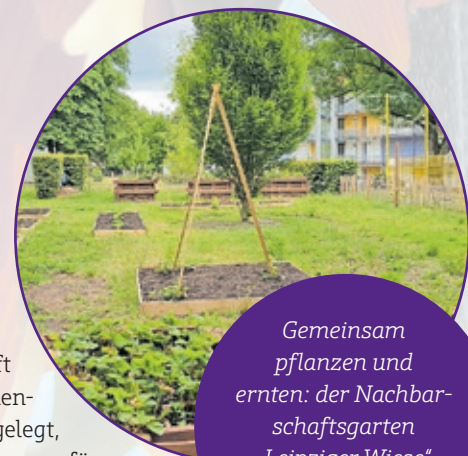
Gemeinsam pflanzen und ernten: der Nachbarschaftsgarten „Leipziger Wiese“ im Sommer 2022.

Auf der Website gibt es neben einer Übersicht über die Standorte der verschiedenen Stadtgärtchen auch Informationen darüber, wann im Jahr welches Obst und Gemüse geerntet werden kann.