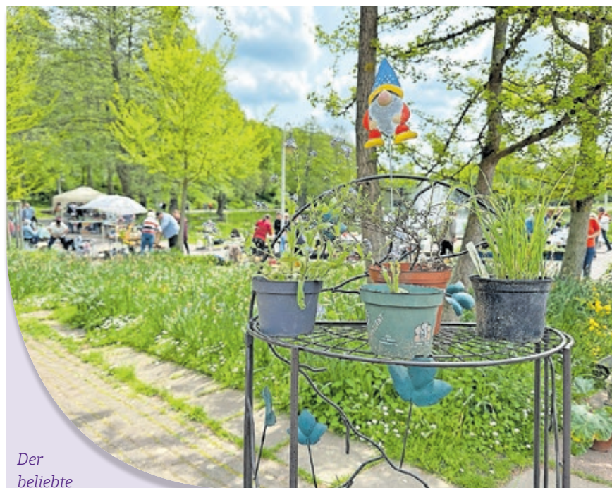
Der beliebte Pflanzenflohmarkt bringt zweimal im Jahr Hobbygärtnerinnen und -gärtner zusammen.