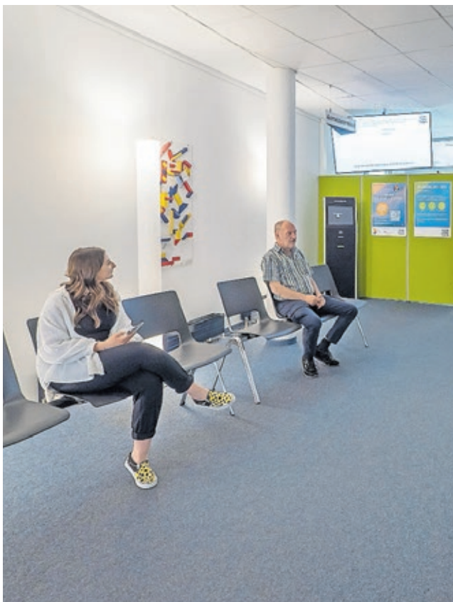
Für den Wartebereich wurden unter anderem neue Stühle angeschafft.

Im Zuge der Modernisierung wurde zudem die Beschilderung im Eingangs- und Wartebereich erneuert, um Bürgerinnen und Bürgern die Orientierung im Amt zu erleichtern.