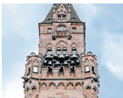
Das Glockenspiel im Turm des Rathauses St. Johann.

Anlässlich der Fête de la Musique spielt das Glockenspiel im Turm des Saarbrücker Rathauses ab Mittwoch, 21. Juni, Melodien aus Serbien, Litauen und Luxemburg. Weitere Volkslieder aus den mitteleuropäischen Ländern Slowakei, Ungarn und Polen ergänzen das Programm.