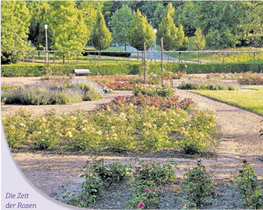
Die Zeit der Rosen ist gekommen – im DFG sind viele wunderschöne Exemplare im Rosengarten zu bewundern.