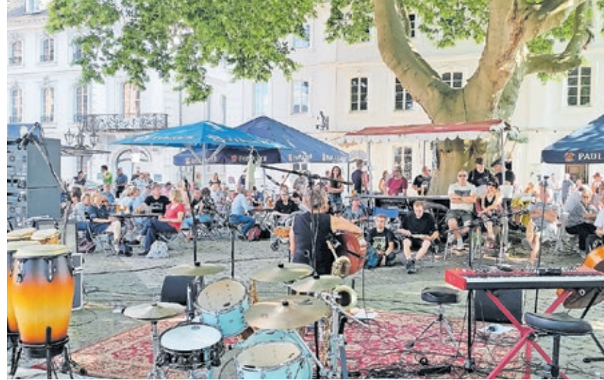
Während der Fête de la Musique erklingt an vielen verschiedenen Stellen im Saarbrücker Stadtgebiet Musik.

Interessierte können sich per E-Mail an groove-prinzip@freenet.de für den Workshop anmelden. Mit zahlreichen Straßenkonzerten geht es am Freitag,