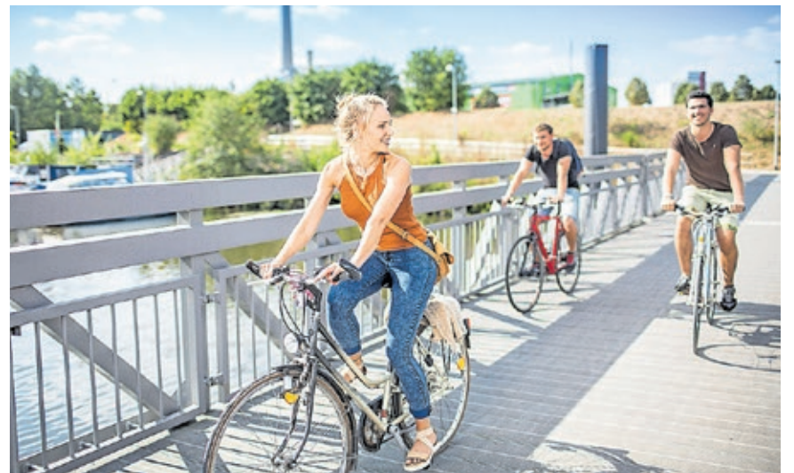
Beim „Stadtradeln“ treten Teilnehmerinnen und Teilnehmer für den Klimaschutz in die Pedale.

Das „Stadtradeln“ in Saarbrücken wird gefördert durch das Ministerium für Umwelt, Klima, Mobilität, Agrar und Verbraucherschutz des Saarlandes. Die Landeshauptstadt und das Ministerium werden besonders engagierte Teams in verschiedenen Kategorien mit Preisen auszeichnen.