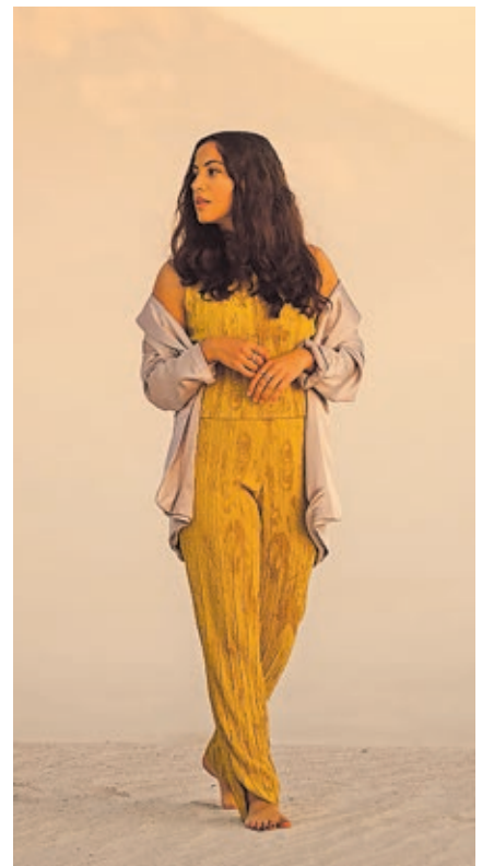
Namika ist einer der Top Acts beim diesjährigen Altstadtfest.

Während des Fests finden Personen mit Kommunikationsbeeinträchtigungen auf dem Cora-Eppstein-Platz Kommunikationstafeln. Dort widmet sich eine Podiumsdiskussion unter dem Titel „#gemeinsamLaut“ am Samstag, 16 Uhr, dem Thema „Verständigen“. Ausschnitte aus dem Inklusionsmusical „Alles ist möglich“ sind am Sonntag, 11 Uhr, auf der Bühne vor dem Staatstheater zu sehen. Ein barrierefreier Sommer-Tanzabend findet am Freitagabend auf der Kinderwiese statt. Das Programmheft ist diesmal in Leichter Sprache verfasst.