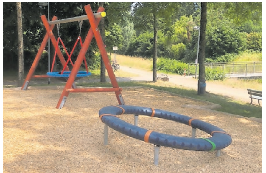
Kinder können gemeinsam schaukeln und auf einem Karussell-Spielgerät ihre Geschicklichkeit testen.

diesem Hintergrund hatte der Bezirksrat Dudweiler im September 2021 beschlossen, dass der Spielplatz reaktiviert werden sollte.