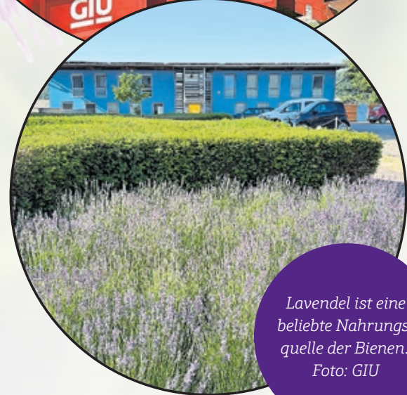
Lavendel ist eine beliebte Nahrungsquelle der Bienen.

sammenkommen. Dazu müssen die Gegebenheiten passen: Es darf nicht zu heiß und nicht zu kalt, nicht zu nass und nicht zu trocken sein. Außerdem müssen die Bienen an Bäumen und Blumen genug Nektar, Pollen und Honigtau sammeln können. Da die Menge, die von den GIU-Bienen stammt, vergleichsweise gering ausfällt, wird der Honig der GIU nur intern verwendet.