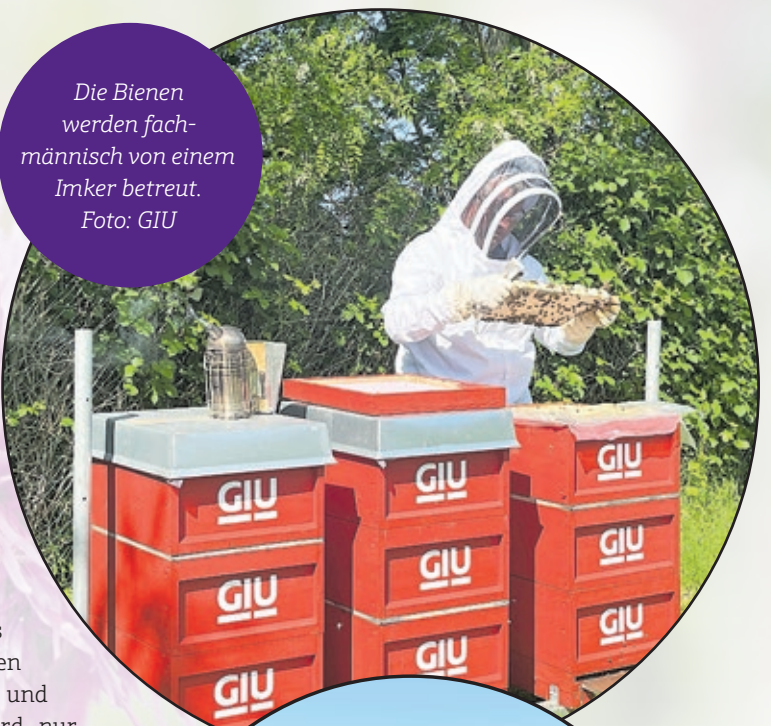
Die Bienen werden fachmännisch von einem Imker betreut.

Am Standort des Hochhauses Königsbruch 1 auf der Folsterhöhe hat die Saarbrücker Siedlungsgesellschaft Farbe in den Stadtteil gebracht: Auf einer Fläche von 170 Quadratmetern wurden dort im Sommer 2021 sogenannte Wildstaudenmatten mit 29 unterschiedlichen Pflanzen verlegt. Momentan blühen dort unter anderem Verbena, Margeriten, Salbei, Storchschnäbel und Naternköpfe. Am längsten zeigen sich die gelben Astern: Von März bis November erfreuen sie mit ihrer Farbenpracht die Betrachterinnen und Betrachter. Die meisten Pflanzen haben ihre Blütezeit zwischen Juni und September. Besonders hoch hinaus kommen zwei Glockenblumen, die bis zu drei Meter groß werden.