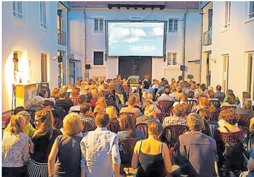
Unter freiem Himmel Kinofilme schauen – das geht im Juli und August wieder im Innenhof des Filmhauses.