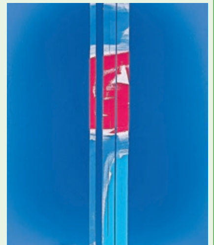
Claire Weides „Übergreifende Positionen“.