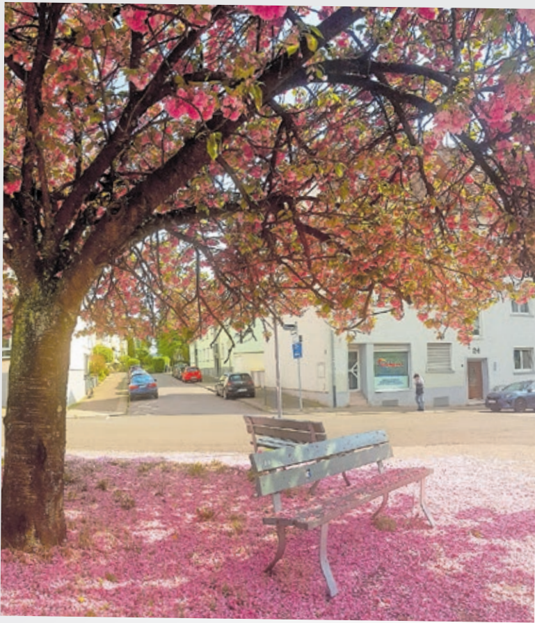
Die Bank im rosa Blütenmeer auf dem Rodenhof hat den meisten Instagram-Nutzerinnen und -nutzern gefallen.