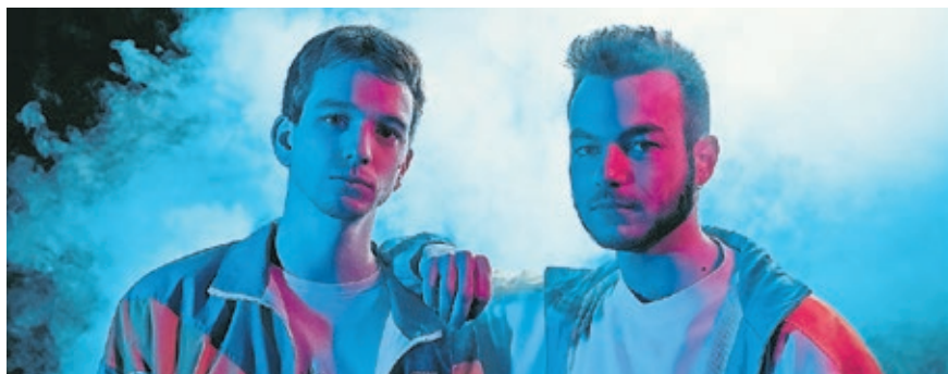
Die Band „Shelter Colony“ aus Nantes spielt auf der Rockwiese auf dem Saarbrücker Altstadtfest.