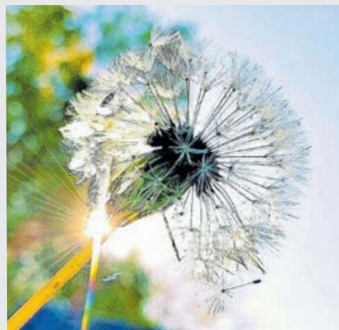
Pustebblumen können richtig poetisch sein – wie dieses Foto beweist.