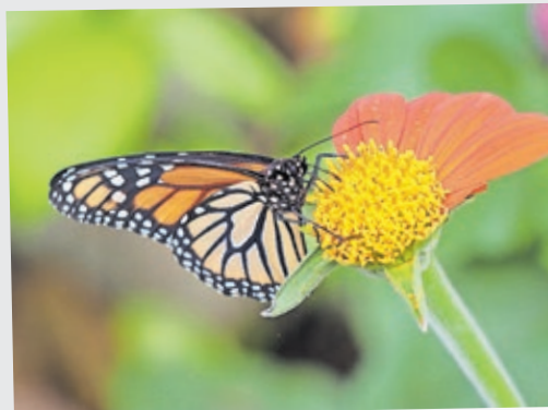
Ein kleiner Glücksmoment in Großaufnahme.