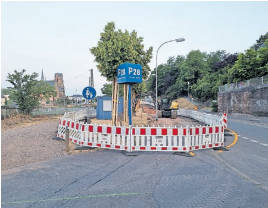
In der Lebacher Straße in Malstatt wird unter anderem eine Lücke im Radweg geschlossen.

Die Gesamtmaßnahme kostet rund 700.000 Euro und dauert voraussichtlich bis in den September.