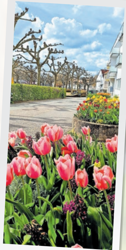
So schön blühen im Frühjahr die Tulpen am Nanteser Platz.

Im Rahmen der „Blühendes-Saarbrücken-Foto-Challenge“ hatte die Landeshauptstadt Saarbrücken in den vergangenen Wochen die schönsten Blumen- und Blüten-Fotos aus der Stadt gesucht. Bei der Onlineredaktion wurden zahlreiche Bilder eingesandt, eines schöner als das andere. Eine Auswahl der Fotos wurde auf dem städtischen Instagram-Profil hochgeladen. Die meisten „Gefällt mir“-Angaben konnte das Foto von Oliver Siegemund vom Rodenhof sammeln, das dementsprechend zum Siegerfoto gekürt wurde. Oliver Siegemund hat dafür einen 50 Euro-Gutschein für den Einkauf bei der Gärtnerei Birkenmeier in Saarbrücken gewonnen. Eindrücke von den schönsten Blütenfotos aus Saarbrücken gibt es auf dieser Seite.