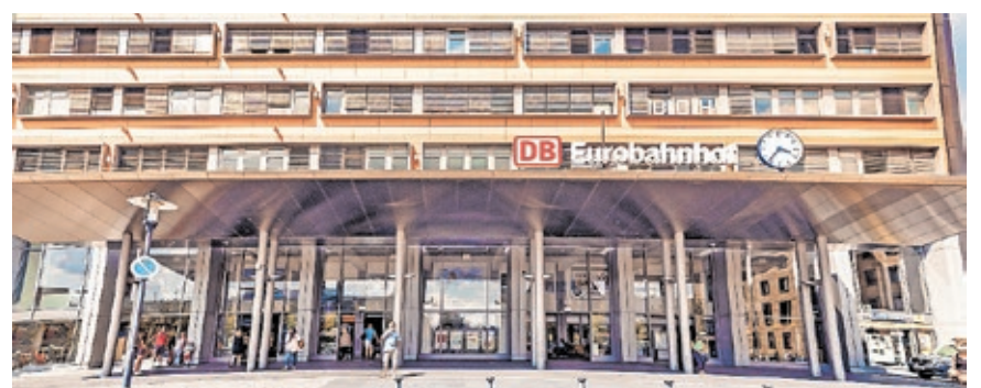
Der Saarbrücker Hauptbahnhof.

Mit einer Verbindung über Saarbrücken könnten die Menschen in Rheinland-Pfalz besser an Paris angebunden werden. Außerdem verfügten nahegelegene Großstädte wie Trier nicht über eine direkte Bahnanbindung an Berlin. Eine Strecke über Saarbrücken verbinde die Region auch besser mit Berlin.