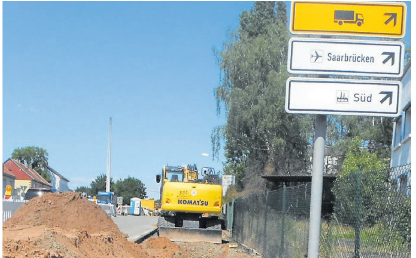
In der Metzger Straße baut die Landeshauptstadt einen neuen Geh- und Radweg.

Neben dem eigentlichen Bau des Geh- und Radwegs sind mehrere weitere Arbeiten geplant. Neu angelegt werden beispielsweise zwei begrünte Mittelinseln, um den Straßenraum zu gliedern und gestalterisch aufzuwerten. Außerdem sollen mehrere Stellen, an denen Passantinnen und Passanten, Radfahrerinnen und Radfahrer bereits jetzt die Straße überqueren können, barrierefrei umgebaut werden. Für fünf Bushaltepunkte in der Metzger Straße beziehungsweise der Straße „Am Hauptfriedhof“ ist ebenfalls ein barrierefreier Umbau vorgesehen. Auf der kompletten Länge der 1,4 Kilometer wird abschließend die Fahrbahndecke der Metzger Straße instandgesetzt. Im Zuge der Maßnahme