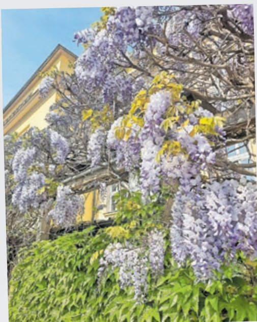
Instagram-Nutzerin „yavityska“ hat die Glyzinien abgelichtet, die das Staatstheater schmücken.