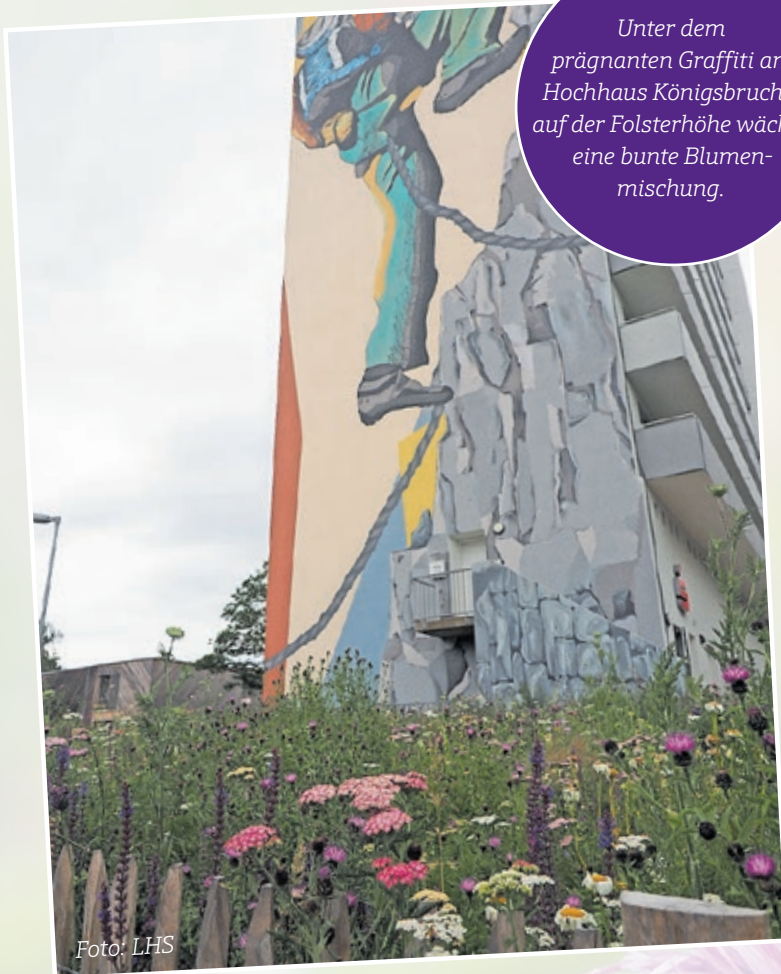
Unter dem prägnanten Graffiti am Hochhaus Königsbruch 1 auf der Folsterhöhe wächst eine bunte Blumenmischung.