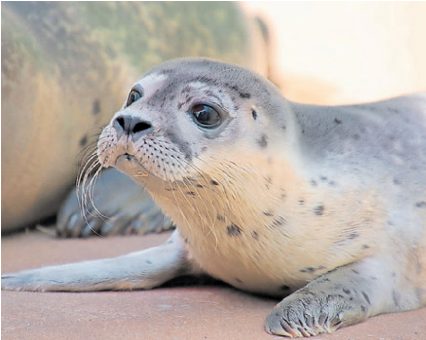
Das neue Seehundbaby ist der Stolz des Zoo-Teams.