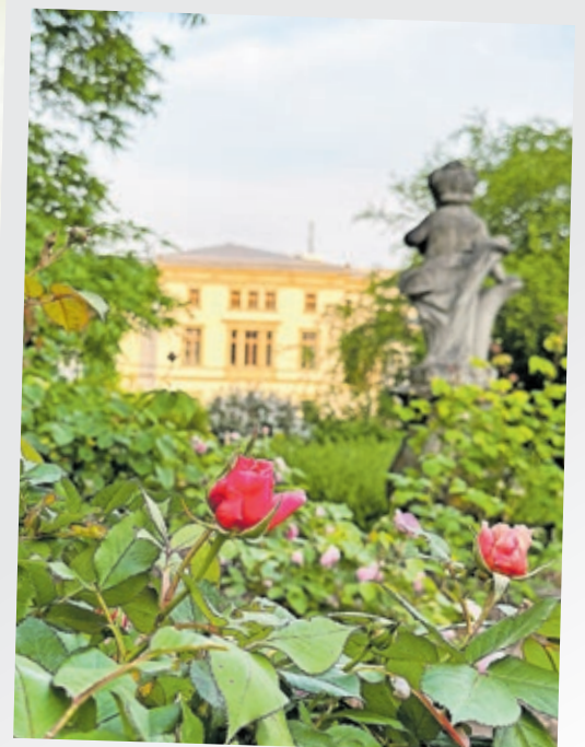
Blick vom Schlossgarten auf den Landtag.