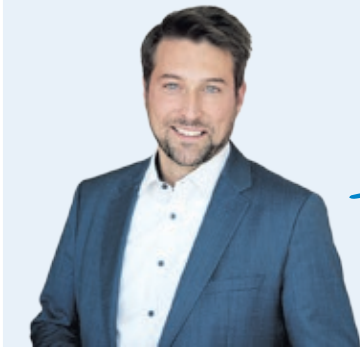
Uwe Conrads Oberbürgermeister der Landeshauptstadt Saarbrücken

Die Stadt übernimmt Verantwortung für ihr Klinikum am Winterberg. Wir fangen Defizite auf, die durch ein mangelhaftes System bedingt sind. Doch jetzt müssen Bund und Land Verantwortung übernehmen, sonst ist die Gesundheitsversorgung im Land in Gefahr. Das kann unsere Stadt nicht auffangen. Bund und Land müssen mehr Geld auf den Tisch legen.