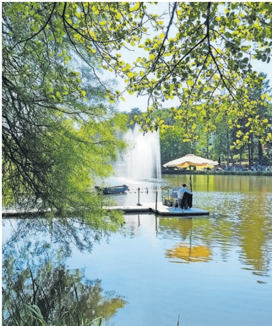
Der Deutschmühlenweiher mit der Wasserorgel ist das Herzstück des DFG.