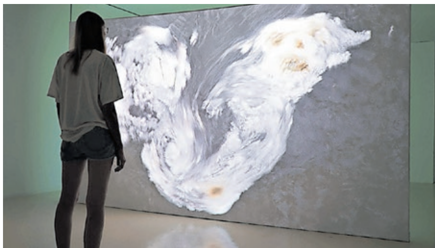
Projektion des Video-Künstlers François Schwaborn im Rahmen der SaarART 2023 in der Stadtgalerie.

Stadtgalerie Saarbrücken Telefon: +49 681 905-1843 E-Mail: stadtgalerie@saarbruecken.de Internet: stadtgalerie.saarbruecken.de