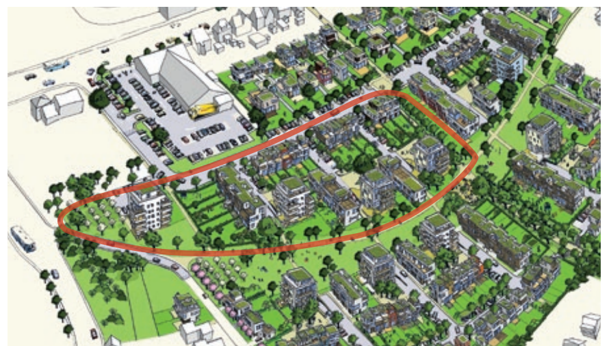
Übersicht über den Bereich des dritten Bauabschnitts am Franzenbrunnen in Alt-Saarbrücken. Grafik: GIU