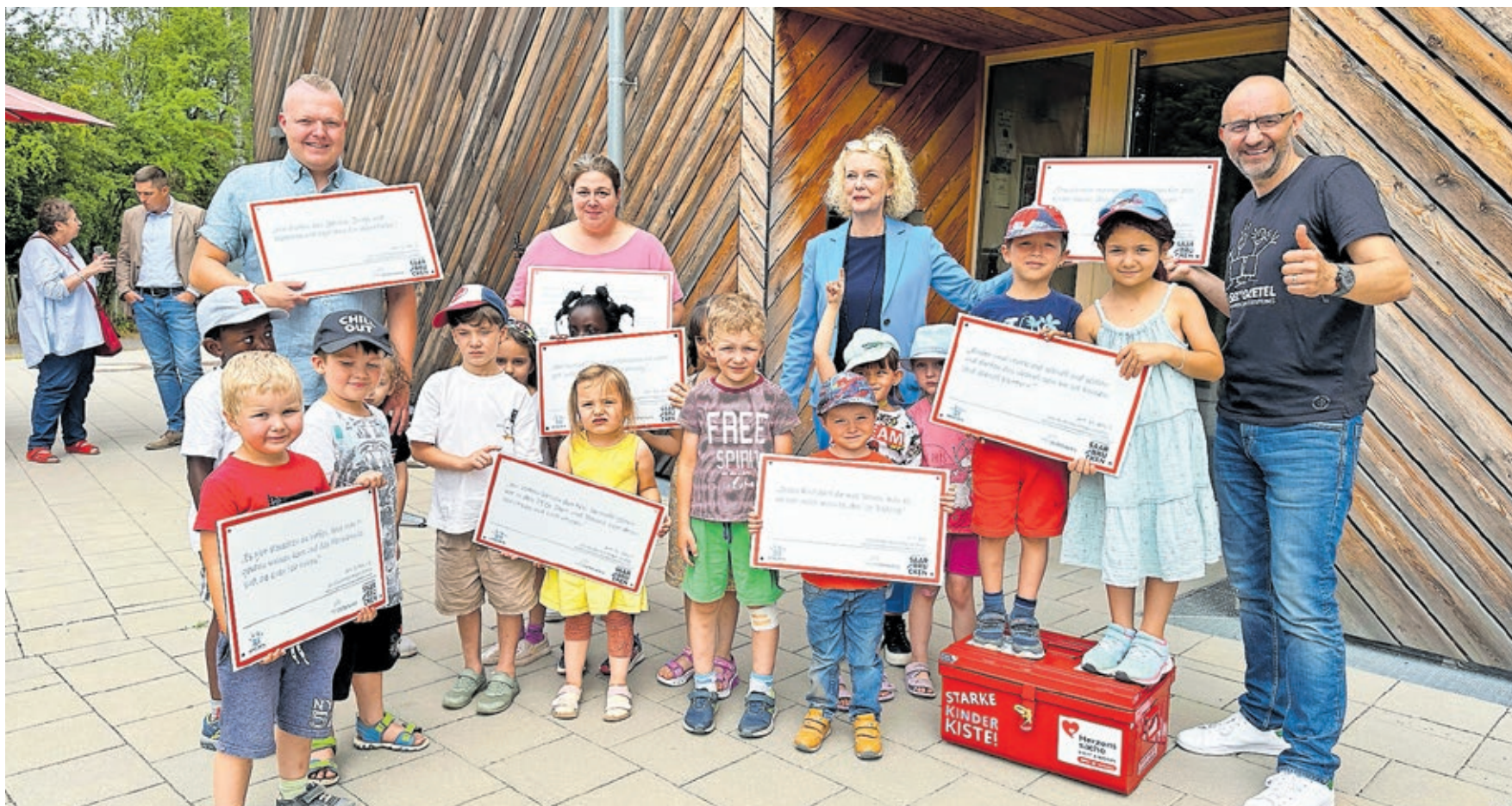
Die Kinder, Erzieherinnen und Erzieher der städtischen Kita Hirtenwies sind für ihr besonderes Engagement für Kinderrechte ausgezeichnet worden.