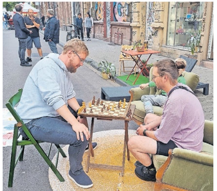
Die Sommerstraßen im Nauwieser Viertel sind Treffpunkt für die Nachbarschaft und bieten unter anderem die Möglichkeit zum gemeinsamen Spielen.