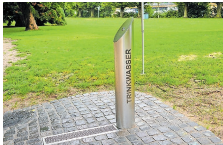
Am Staden in der Nähe des Ulanen-Pavillons steht seit Anfang August ein neuer Trinkwasserbrunnen.

wehrplatz musste aufgrund gestiegener technischer Anforderungen außer Betrieb gesetzt werden. Es ist geplant, ihn perspektivisch durch ein neues Modell zu ersetzen.