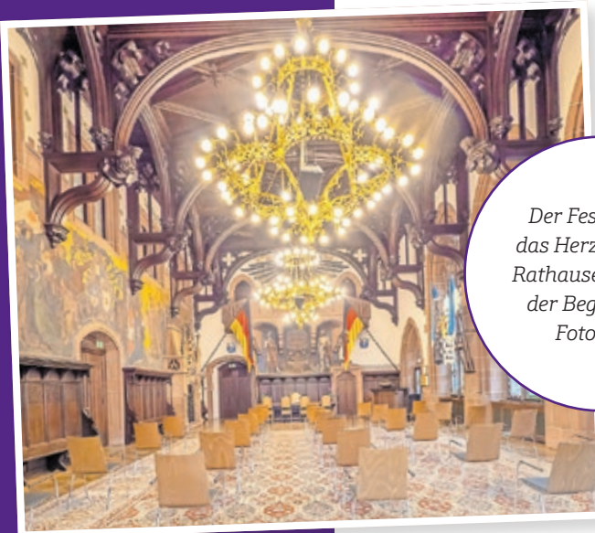
Der Festsaal ist das Herzstück des Rathauses und Ort der Begegnung.

Der Grazer Georg Joseph von Hauberrisser studierte Architektur in München, Berlin und Wien, wo er sich vom Stil der Neogotik inspirieren ließ. Ab 1867 erbaute er sein bedeutendstes Werk: das Neue Münchner Rathaus. Insgesamt entwarf er sieben Rathäuser, darunter eines in Wiesbaden, deren architektonische Ähnlichkeiten mit bloßem Auge erkennbar sind. Hauberrisser erhielt viele wichtige Auszeichnungen für seine Arbeit.