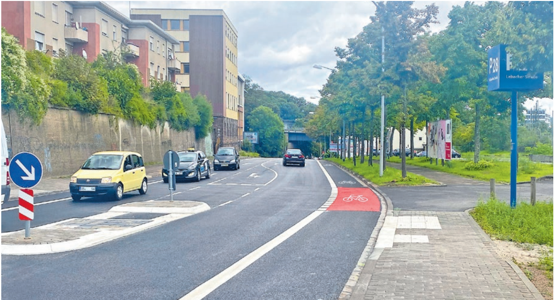
Fahrradfahrerinnen und Fahrradfahrern steht ab sofort ein neu eingerichteter Radweg zur Verfügung.