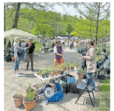
Beim Pflanzenflohmarkt im Deutsch-Französischen Garten werden nicht nur Hobbygärtnerinnen und -gärtner fündig.