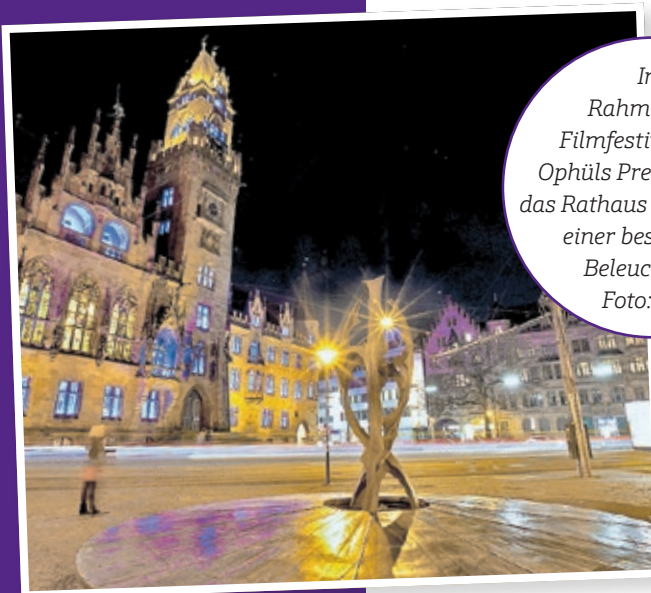
Im Rahmen des Filmfestivals Max Ophüls Preis erstrahlt das Rathaus St. Johann in einer besonderen Beleuchtung.