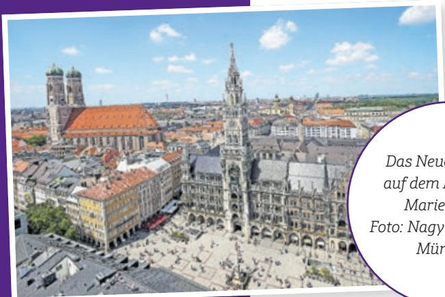
Das Neue Rathaus auf dem Münchner Marienplatz.