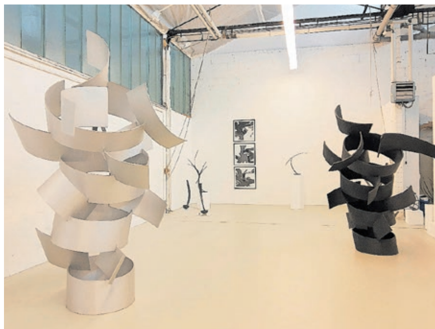
Im Quartier Eurobahnhof können Interessierte unter anderem das Atelier von Sigrún Ólafsdóttir besuchen.