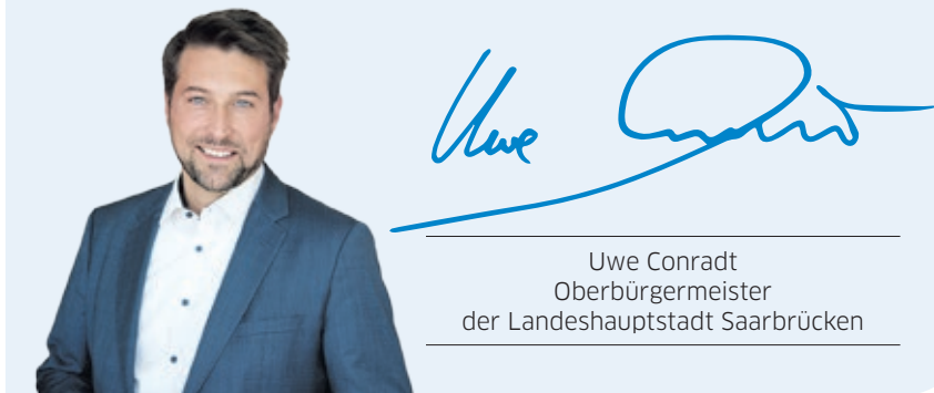
Uwe Conradt Oberbürgermeister der Landeshauptstadt Saarbrücken

Doch auch jeder Einzelne ist gefragt, denn es gibt noch einiges zu tun für ein sauberes Saarbrücken.