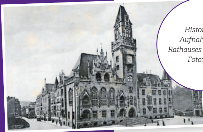
Historische Aufnahme des Rathauses St. Johann.