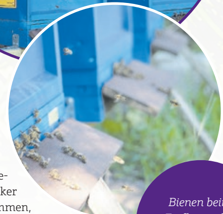
Bienen beim Einflug in den Stock im DFG.