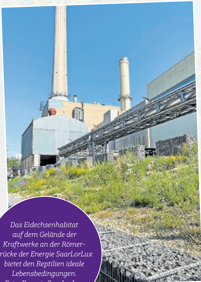
Das Eidechsenhabitat auf dem Gelände der Kraftwerke an der Römerbrücke der Energie SaarLorLux bietet den Reptilien ideale Lebensbedingungen.