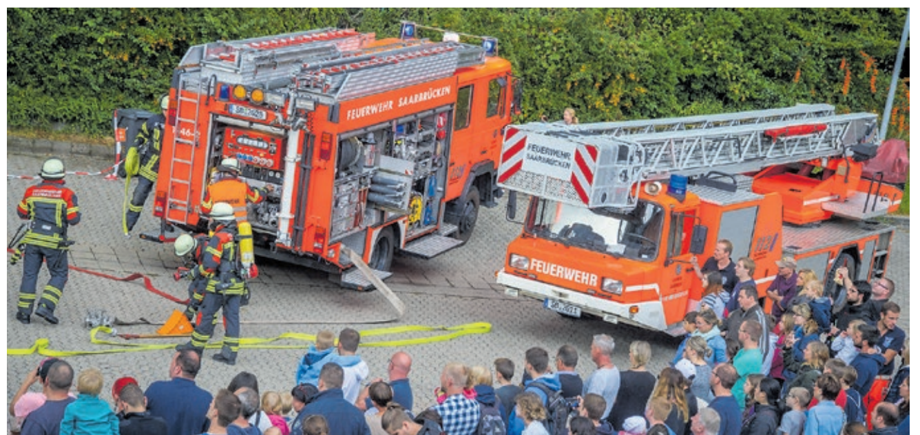
An den Tagen der offenen Tür können die Besucherinnen und Besucher spannende Schauübungen erleben.