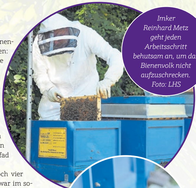
Imker Reinhard Metz geht jeden Arbeitsschritt behutsam an, um das Bienenvolk nicht aufzuschrecken.