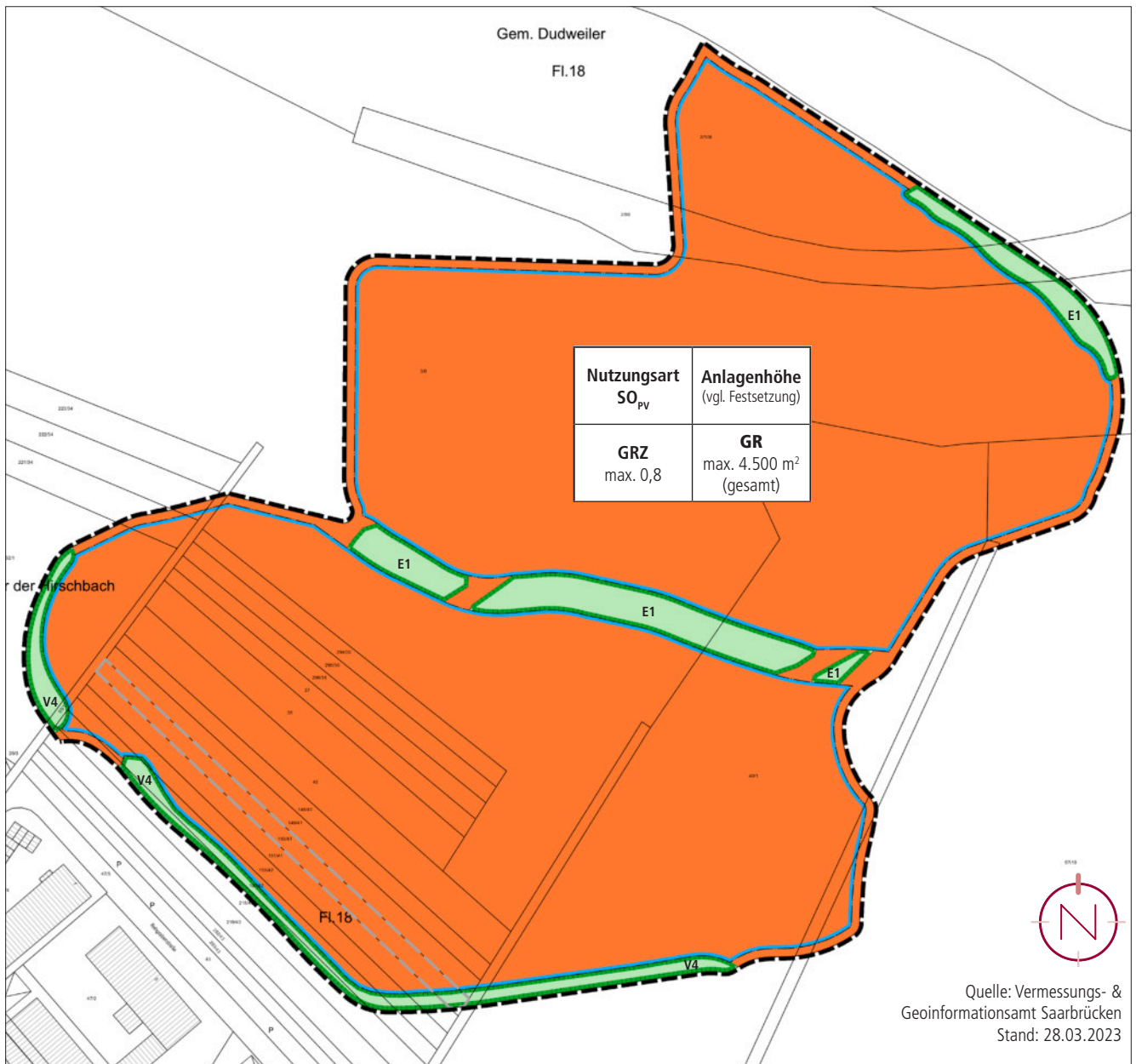
Auszug vorhabenbezogener Bebauungsplan; ohne Maßstab; Quelle: Kernplan GmbH