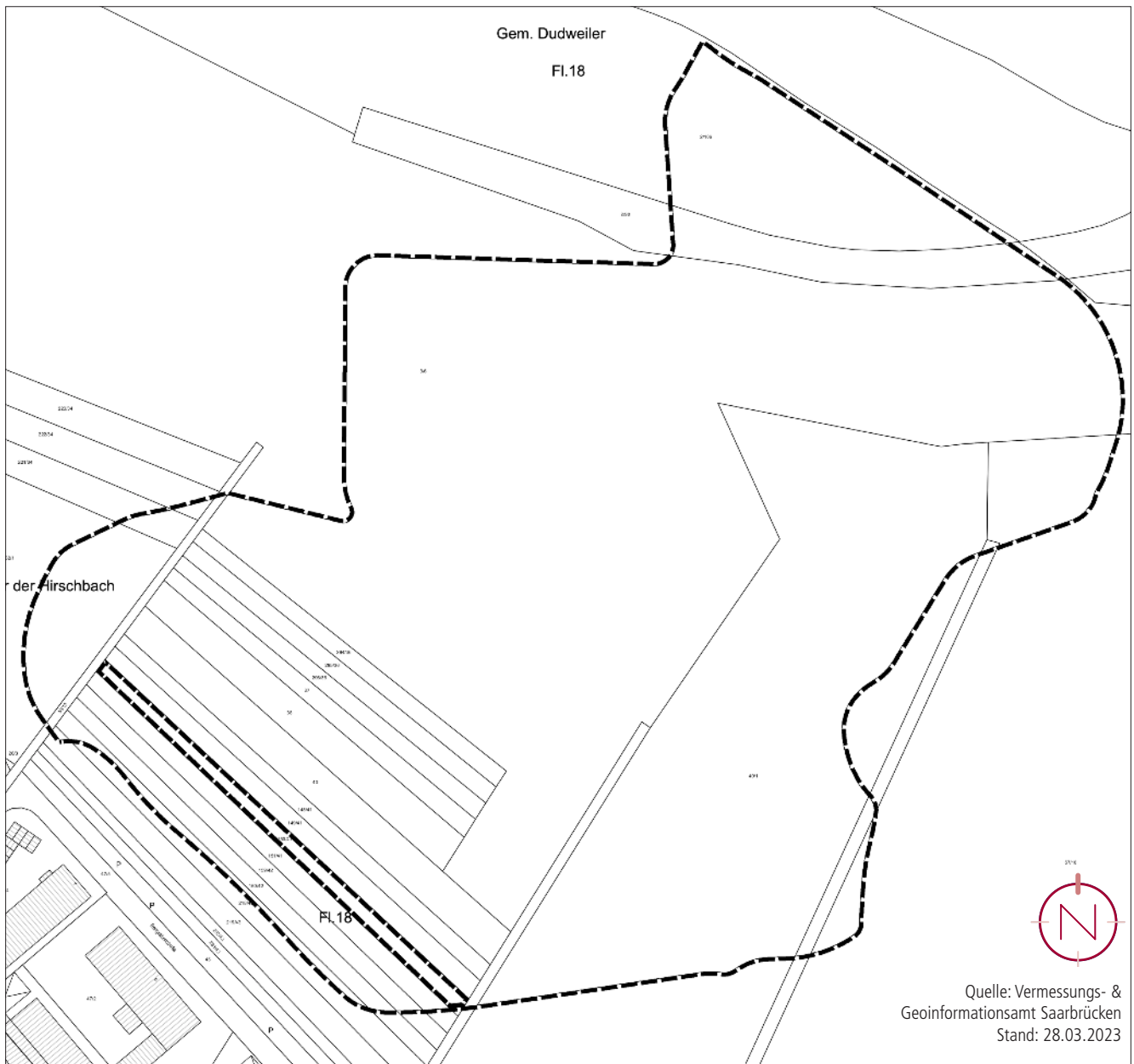
Lageplan mit Geltungsbereich vhbz. Bebauungsplan; ohne Maßstab; Quelle: Kernplan GmbH