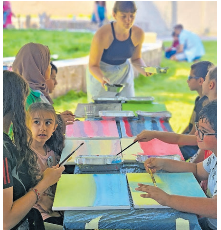
Im Rahmen des Programms des Sommer-Sprachcamps können sich die Kinder auch künstlerisch betätigen.

In diesem Jahr findet das Sommer-Sprachcamp zum ersten Mal auf dem Gelände der neu erbauten Bildungswerkstatt Kirchberg statt. Am Freitag, 2. August, 13 Uhr, wird ein großes Abschlussfest veranstaltet. In diesem Rahmen finden eine Kunstausstellung, eine Kinderolympiade und eine Vorstellung der Sprach-Rikschas statt. Die Veranstaltung endet gegen 15 Uhr.