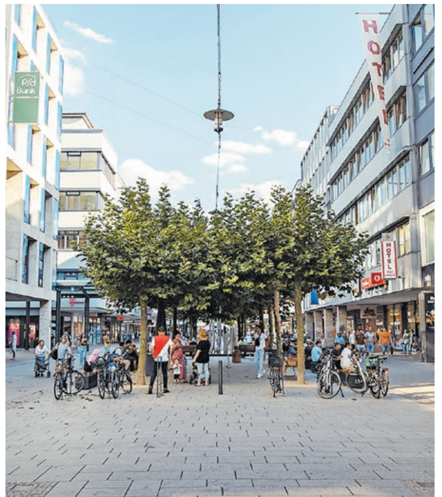
Die Bahnhofstraße zählt zu den beliebtesten Einkaufsstraßen in Deutschland. Die Landeshauptstadt entwickelt die Innenstadt mit gezielten Maßnahmen stets weiter.

Umgekehrt können ansiedlungswillige Unternehmen und Konzeptanbietende, die auf der Suche nach Flächenangeboten sind, über den Gesuchsmelder ( www.saarbruecken.de/gesuchsmelder ) ihre Suchparameter übermitteln. Die Wirtschaftsförderung vernetzt dann die Immobiliensuchenden mit möglichen Eigentümern oder Maklern.