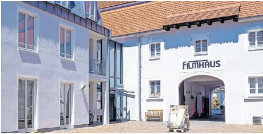
Kino unter freiem Himmel bietet das Filmhaus noch bis Ende August.