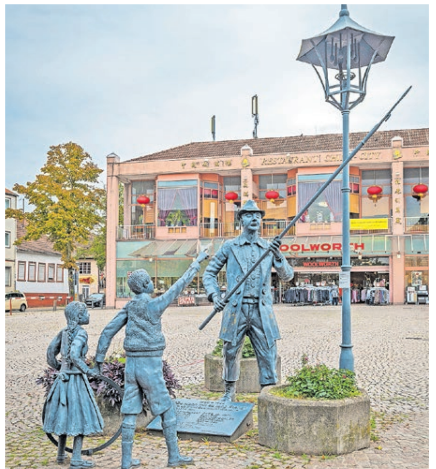
„De Monn mit da long Stong“ ist ein Wahrzeichen des Stadtteils Dudweiler, in dem eine der Führungen angeboten wird.