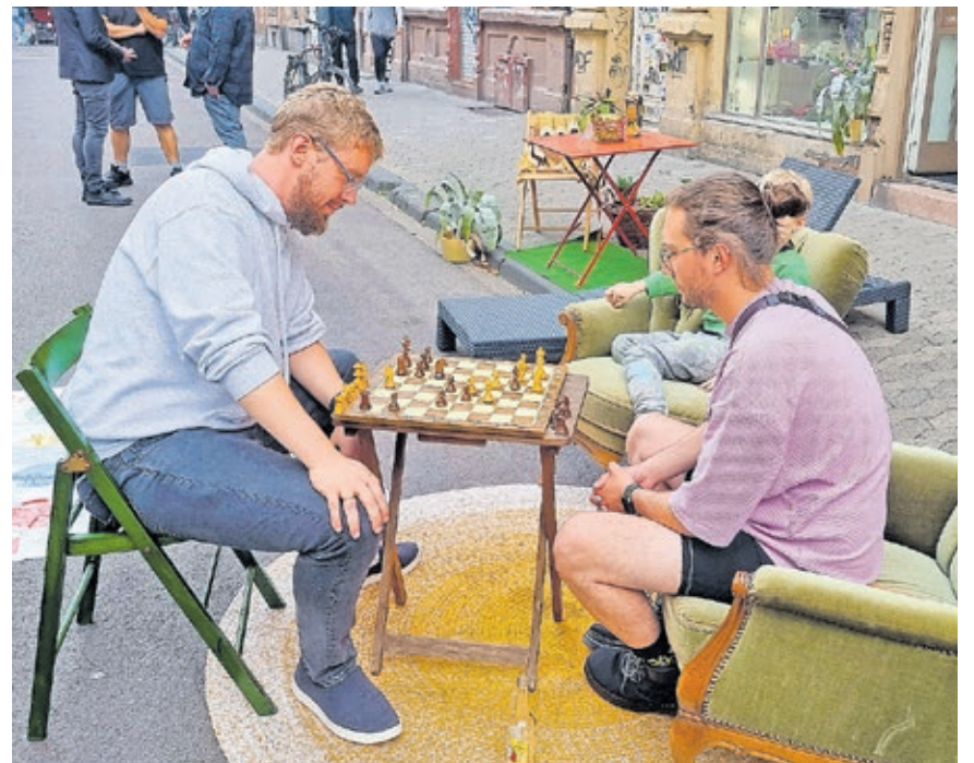
Auch in diesem Jahr beleben die Sommerstraßen das Nauwieser Viertel und bieten unter anderem die Möglichkeit zum gemeinsamen Spielen.