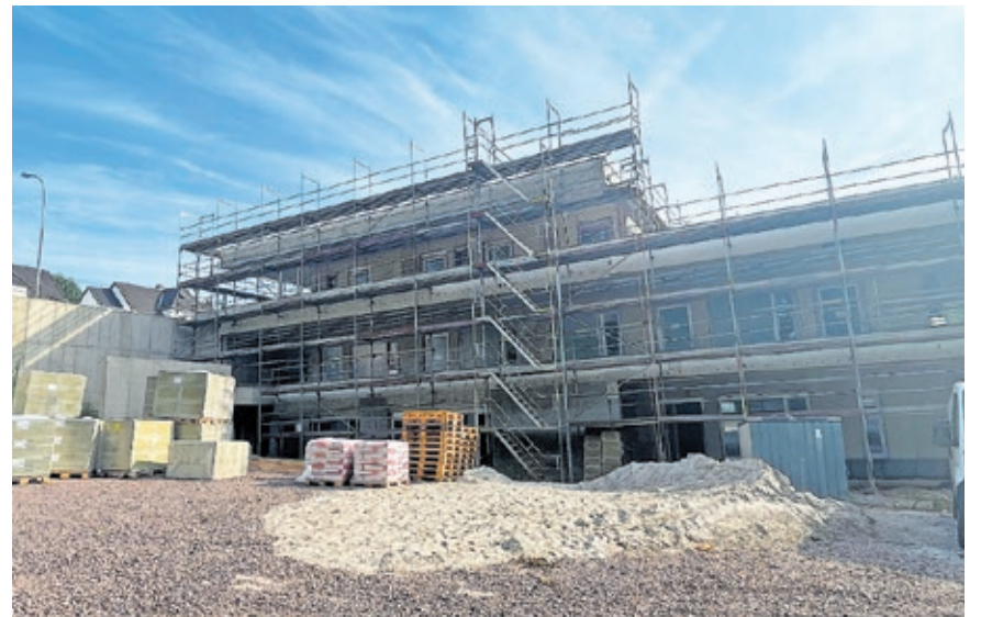
Fünf Kindergarten- und zwei Krippengruppen erhalten in der neuen Kita Lindenberg Platz.

Im August wird die Sommertour im Bezirk West fortgesetzt. Dort wird sich OB Conradt beispielsweise den Sportplatz des SV Rockershausen ansehen. Die Landeshauptstadt investiert hier unter anderem in den Ausbau einer 100-Meter-Sprintstreckenabschnittbahn. Darüber hinaus sind Besuche der Kita Füllengarten und des Güterbahnhofs geplant.