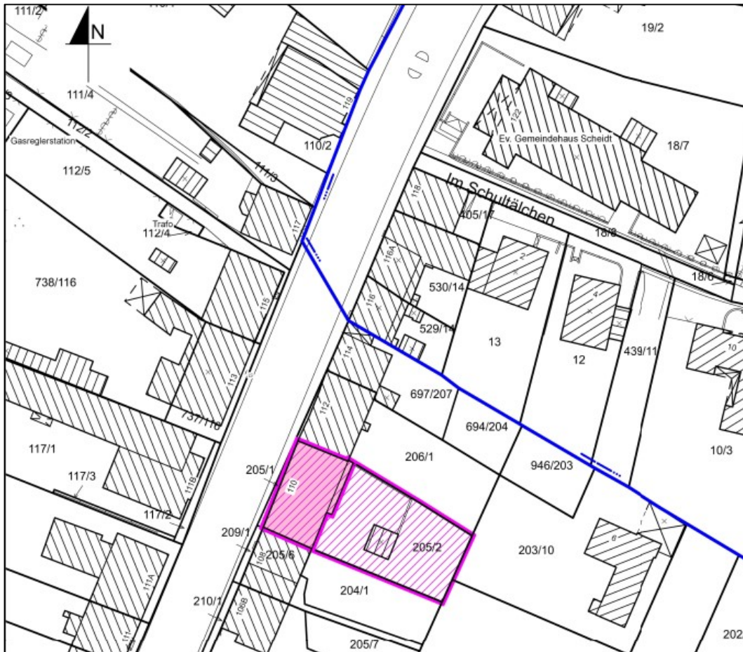
Auszug aus der Stadtgrundkarte

Gemarkung Scheidt, Flur 1, Flurstück 205/2 Gesamtgröße Flurstück: 553 m 2