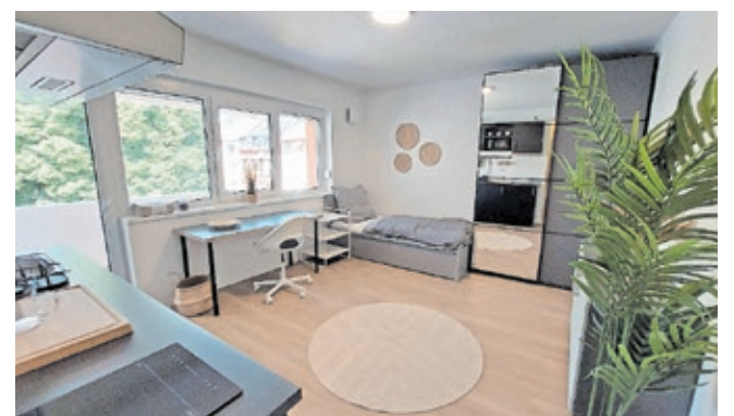
Die Mikroapartments werden vollmöbliert vermietet.