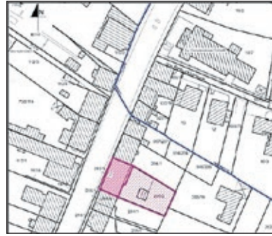
Gemarkung Scheidt, Flur 1, Flurstück 205/2 Gesamtgröße Flurstück: 553 m 2

Der Gebäudemanagementbetrieb der Landeshauptstadt Saarbrücken bietet in Scheidt, Kaiserstraße 110, ein mit einem Gemeindeforum bebautes Grundstück gegen Abgabe eines Gebotes zum Verkauf an: