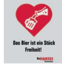
Autor: Melmut Frankhalter

wieviel Linke wechseln hin? Oder doch zuerst das Bündnis Sascha Haas? Wird diesem auch Kessler (cDU) angehören? Wird die FDP der Linie der Bun- despartei folgen und voll- ständig zur reaktionären Autofahrer:innenpartei? Wie oft wird uns Schäfer- Meier (sPD) den Stinkefin- ger zeigen? Lässt Käpt. Lichtlein, Maurer und Akin auch mal zu Wort kommen? Mit wem redet Hanauer (cDU) nach der Sitzung, jetzt wo die verfixxten AfD weg ist? Wird Conradt rumu- wen? Wissen nach all den Parteiwech- seln alle noch, wer gerade wohin gehört (und macht das einen Unterschied?) oder sollen wir Partei-Namens- schilder verteilen? Wird der Rat endlich merken, dass die Anträge von der Fraktion Die FRAKTION der Partei Die PARTEI, die einzigen mit Sinn und Verstand sind? Wir sind ge- spannt.