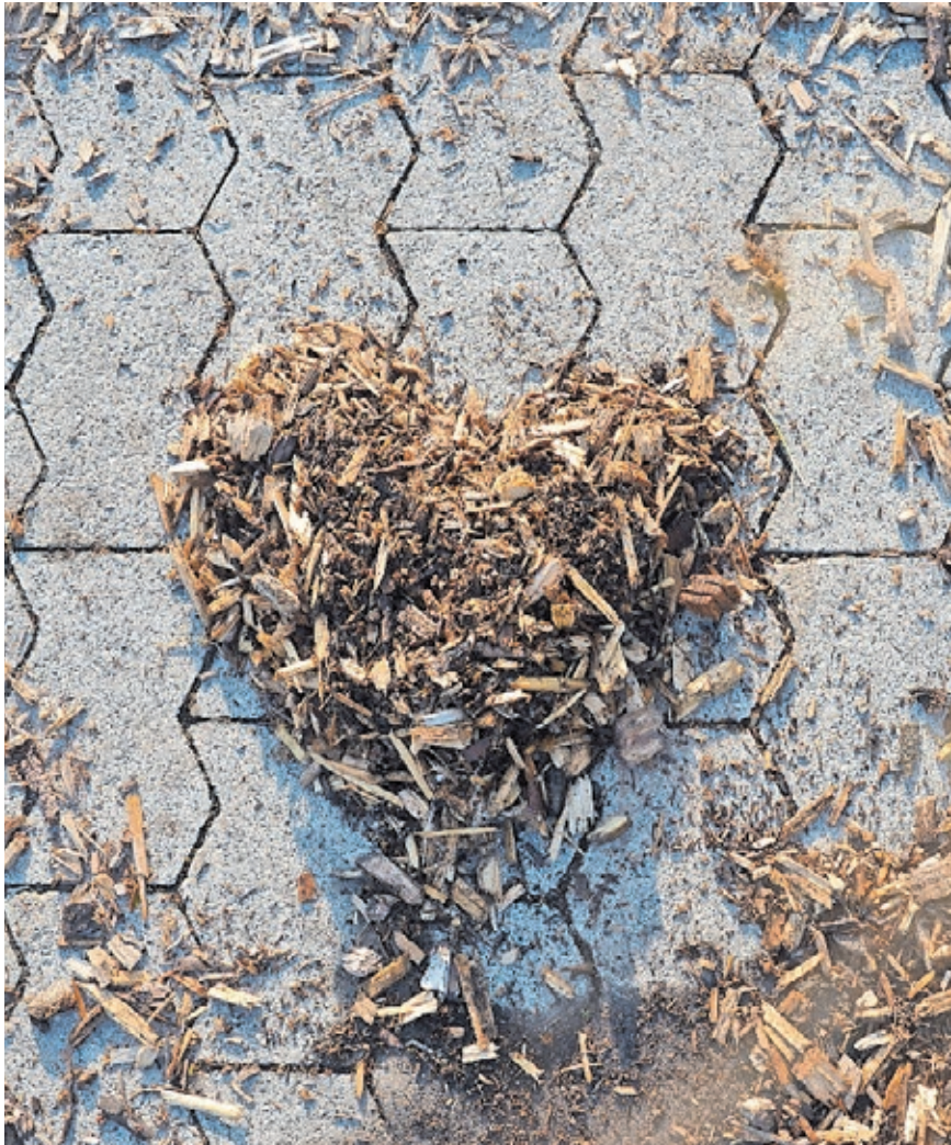
Holzhackschnitzel können beispielsweise Beete verschönern.