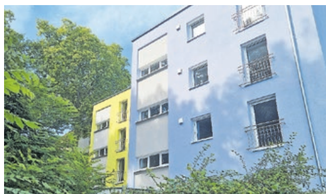
Blick auf eines der sanierten Häuser in der Moltkestraße.