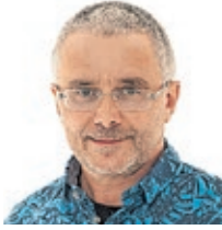
Rainer Ritz

brücken mit dem in Serbien vergleichen? Raten-tod? Oder doch Zukunft? Ford lässt grüßen. Wir fordern von ZF eine Standortsicherheit für Saarbrücken und keine betriebsbedingten Kündigungen. Das ist ZF den Beschäftigten mindestens schuldig. Auch ZF muss einen Beitrag leisten und viel mehr neue Projekte nach Saarbrücken bringen. Das Werk ist hochmodern, hat Zukunft verdient. Was macht das Land? Wirtschaftsminister Barke (SPD) muss endlich was liefern, was zu Ende bringen, nicht immer nur ankündigen. Er hat nur ungelöste Baustellen, SVolt, Ford, Wolfsspeed, Stahltransformation, usw. Wenn bei ZF in Kürze kein belastbares Ergebnis kommt, gehört „Baustellen“-Barke ausgetauscht und die Sache zur Chefsache gemacht.