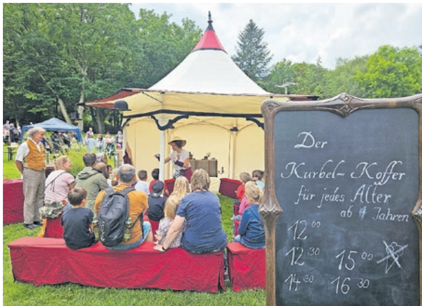
Eindrücke vom Kinderfest 2023.