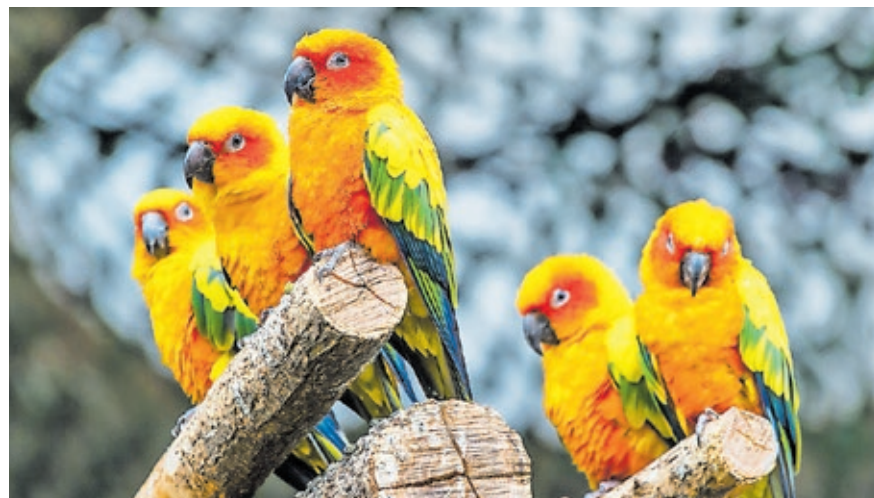
Auch Sonnensittiche sind im Saarbrücker Zoo zu bewundern.

Der Saarbrücker Zoo bietet am Dienstag, 27. August, einen Seniorentag an.