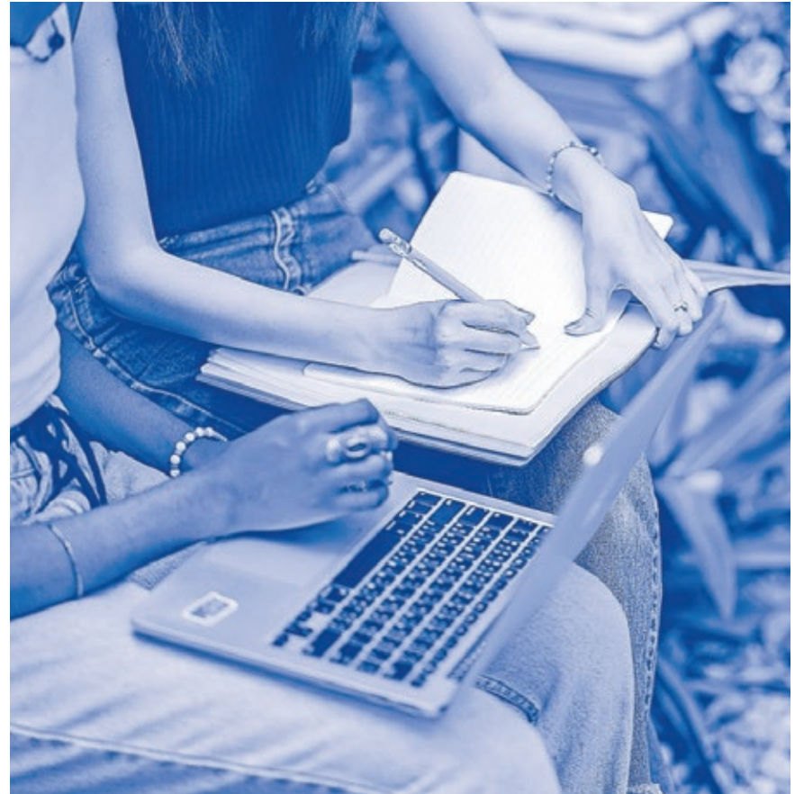
Für die Planungen zur Aufwertung des Luisenviertels ist die Einbindung der Bürgerinnen und Bürger ein wichtiger Baustein.