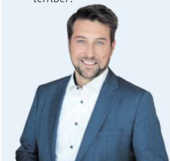
Uwe Conradt Oberbürgermeister der Landeshauptstadt Saarbrücken

Beim „World Cleanup Day“ ist das gemeinschaftliche Anpacken und Müllsammeln eine zusätzliche Motivation. Packen wir es an – am 20. September!