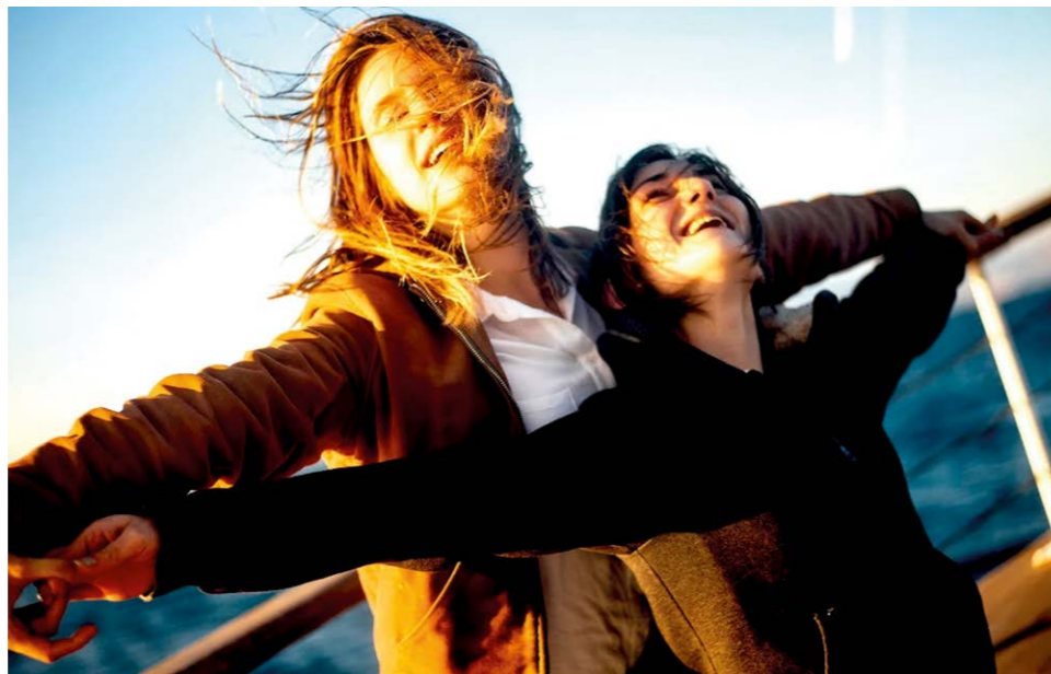
Szene aus dem Film „Djam“

Veranstalter: Stadtbibliothek Saarbrücken Kontakt: +49 681 905-1717, stadtbibliothek@saarbruecken.de