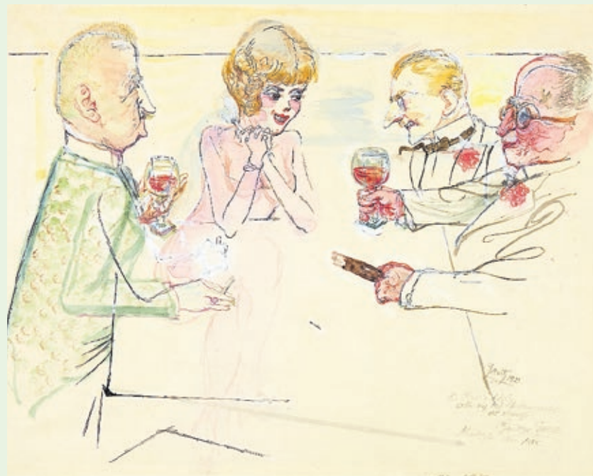
Tischgespräch © Estate of George Grosz, Princeton_VG Bild-Kunst Bonn 2024.

Durch die Ausstellung führt der Kunstpädagoge und Künstler Fred Weber. Nach einer Mittagspause bietet der Fotograf und hauptamtliche