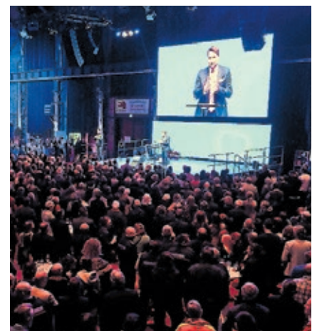
Neujahrsempfang der Landeshauptstadt Saarbrücken im E-Werk.