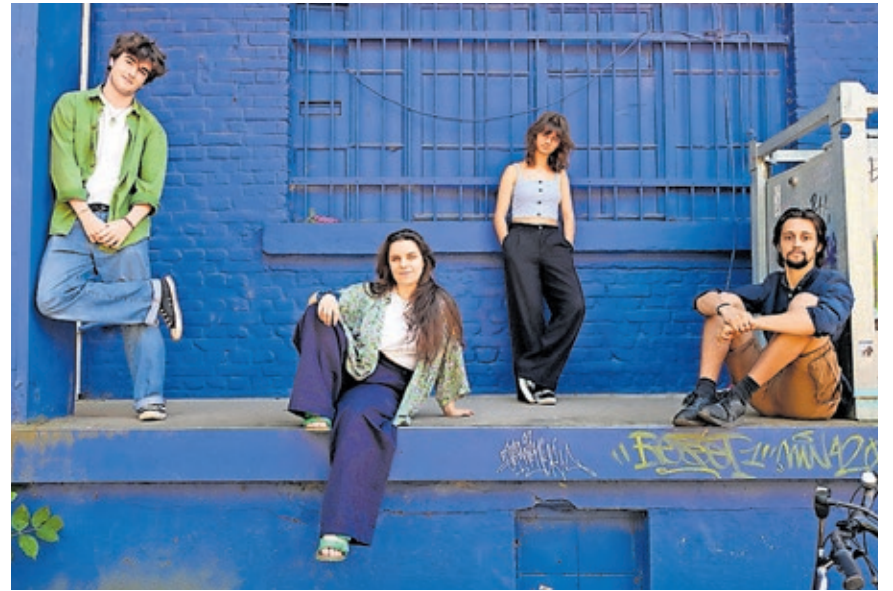
Die Band „Quarter Junction“ eröffnet am 31. Januar die neue Saison der Reihe „JazzZeit“.