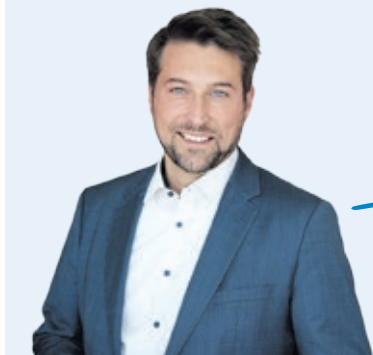
Uwe Conradt Oberbürgermeister der Landeshauptstadt Saarbrücken

Saarbrücken ist bereits jetzt die Hauptstadt der deutsch-französischen Freundschaft und auf dem Weg, deutsch-französische Hauptstadt zu werden.