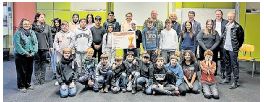
Baudezernent Patrick Berberich (hintere Reihe, 3.v.r.) gratulierte der Gewinnerklasse 6 der Schule im Rastbachtal.

sum, ökologisches Bewusstsein, Recycling und Nachhaltigkeit gelernt. Die Klasse 6 der Schule im Rastbachtal hat mit 935 Kilogramm die meisten Textilien gesammelt und einen Ausflug ins Dynamikum nach Pirmasens gewonnen. Saarbrückens Baudezernent Patrick Berberich gratulierte der Klasse zum ersten Platz.