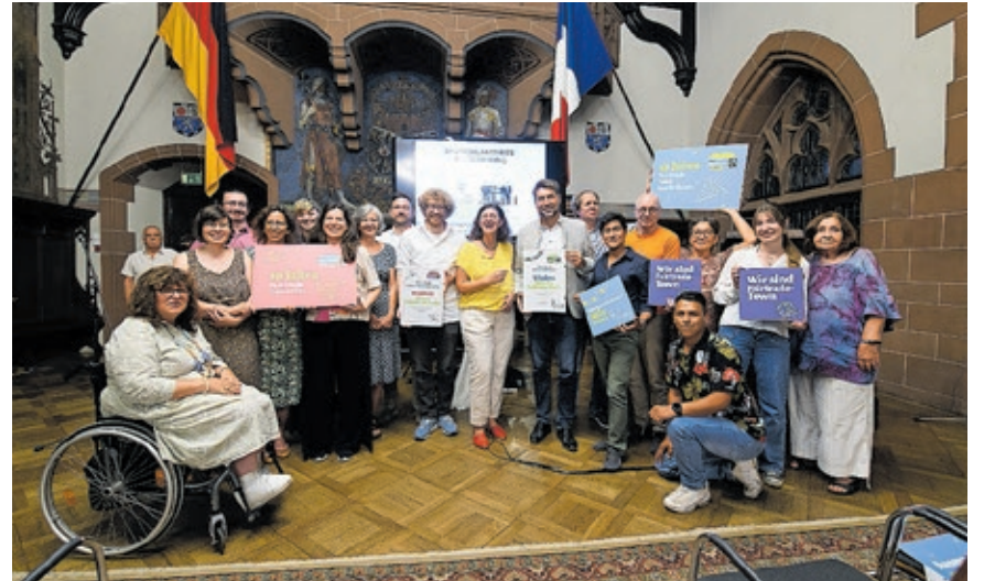
Gleich mehrere Jubiläen von Fairtrade-Institutionen in Saarbrücken wurden letztes Jahr im September im Rathausfestsaal gefeiert.

Dank des anhaltenden Engagements der Landeshauptstadt Saarbrücken, von Saarbrücker Bürgerinnen und Bürgern sowie von Bildungseinrichtungen und Unternehmen darf Saarbrücken für zwei weitere Jahre den Titel „Fairtrade-Stadt“ tragen.